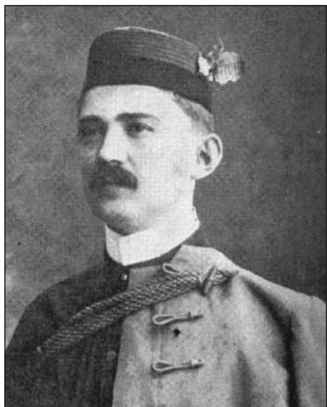
dr. Ivan Ribar

Čelne osobe mjesnih odbora Narodnog vijeća SHS pripadale su krugu najutjecajnijih pojedinaca Hrvatsko-srpske koalicije. U Đakovu je to bio dr. I. Ribar, koji je bio i član Središnjeg odbora Narodnog vijeća SHS u Zagrebu. 13