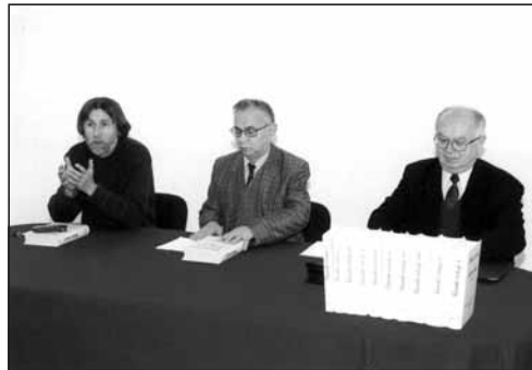
Predstavljanje knjiga Kanonskih vizitacija