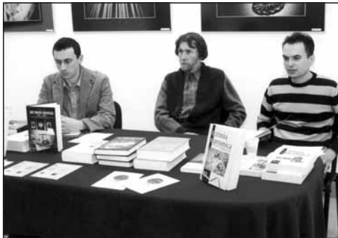
Predstavljene recentnih izdanja Hrvatskog instituta za povijest iz Slavenskog Broda

Predstavljene recentnih izdanja Hrvatskog instituta za povijest iz Slavenskog Broda, Kanonskih vizitacija, Zbornika Muzeja Đakovštine 10 i knjige Đure Frankovića „Blagdanski kalendar“.