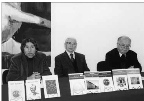
Predstavljanje Zbornika Muzeja Đakovštine 10