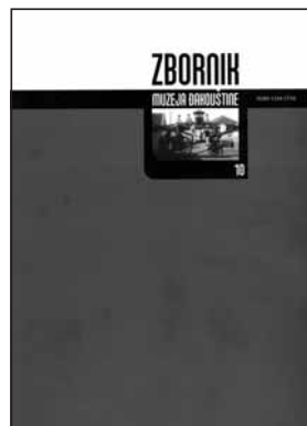
Zbornik Muzeja Đakovštine 10