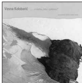
Vesna Kolobarić: „... o vjetru, letu i pokretu!“ (katalog)