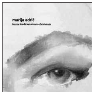
Igor Rončević: Izazov tradicionalnom očekivanju (katalog)