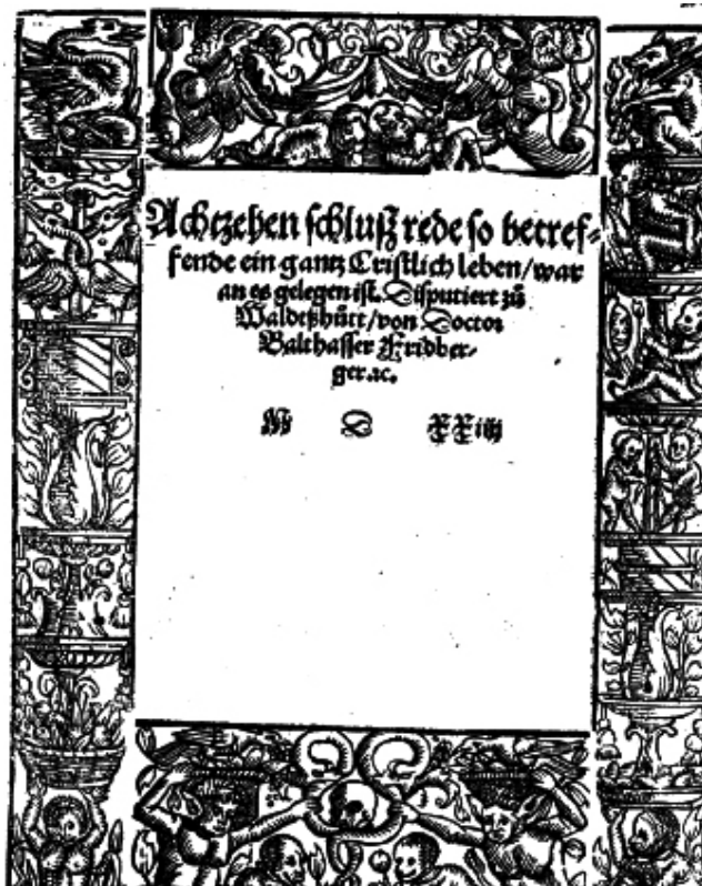
Preslik naslovnice Hubmaierovih teza. Djelo je izdao Ramminger 1524. godine, a čuva se u Staats- und Stadtbibliothek Augsburg.

šćanskom životu i od čega se sastojе). 4 U njemu se u osamnaest članaka govori o cjelokupnom kršćanskom životu. Teze prikazuju Hubmaierovu teologiju, osnove njegove ekleziologije i pastoralne prakse za vjernike Waldshutske crkve. Knjižicu, opsega 8 stranica, objavio je Ramminger 1524. godine, a čuva se u Sttats und Stadtbibliothek u Augsburgu. Njezin je sadržaj bio osnova za kasnije rasprave s ciljem reforme Crkve koja je uslijedila. Slične su se rasprave događale diljem reformacijskih središta. U Zürichu su takve rasprave poticali autoriteti gradskog Vijeća, kao izvršnog tijela za pravna pitanja, diskusije i primjenu zaključaka. U Waldshutu su rasprave bile dijelom redovitih crkvenih službi koje je predvodio Hubmaier smatrajući da zapovijedati može samo onaj koji propovijeda Riječ Božju (Pipkin i Yoder 1989, 31). Smatrao je da gradska vlast nema pravo sudjelovanja u raspra-