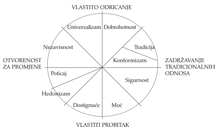
➤ SLIKA 1 Strukturalni odnosi između 10 motivacijskih tipova vrijednosti (preuzeto i prilagođeno prema Schwartz, 1992.)

Na takvu kružnom prikazu kompatibilni se tipovi vrijednosti nalaze jedan do drugog, dok se konfliktni nalaze jedni nasuprot drugima. Od ovakva "pravilnog kružnog rasporeda" odstupa jedino vrijednosni tip "tradicije", koji nije smješten između tipova "konformizma" i "dobrohotnosti", već na samom rubu kružnoga prikaza – iznad vrijednosnoga tipa "konformizma", jer Schwartz smatra (a to su potvrdile već i prve empirijske provjere) da "konformizam" i "tradicija" u osnovi odražavaju isti motivacijski cilj (podređivanje, odnosno prilagođavanje, društveno određenim očekivanjima), a razlika je jedino u tome što "konformizam" odražava podređivanje osobama s kojima je pojedinac u čestom kontaktu, dok "tradicija" odražava podređivanje apstraktnijim pojmovima, točnije religijskim i društvenim običajima i idejama.