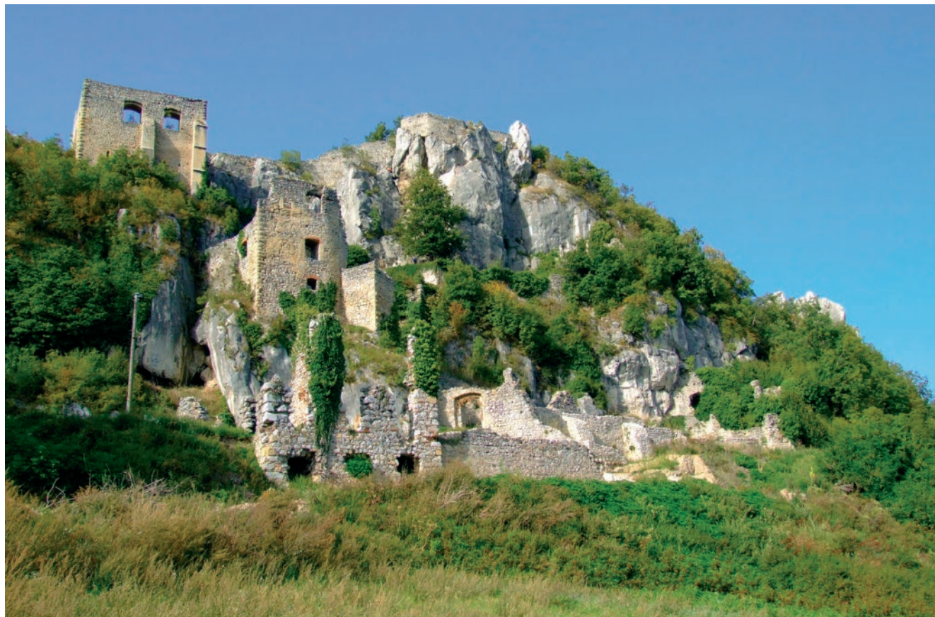
Sl. 4 Ostatci utvrde Veliki Kalnik Fig 4. Remnants of the Veliki Kalnik fortress