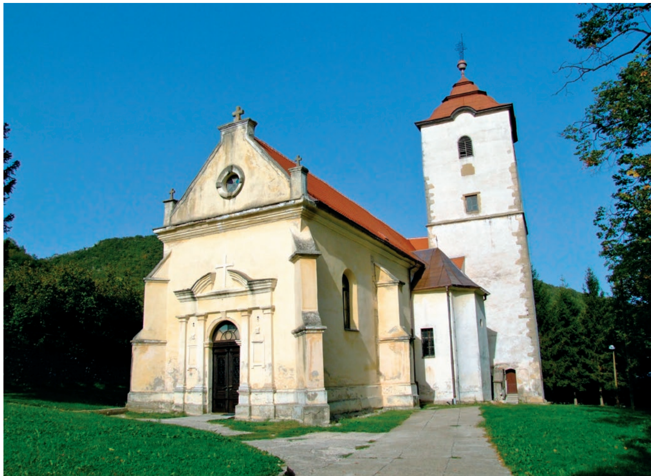
Sl. 5 Župna crkva sv. Brcka u selu Kalnik