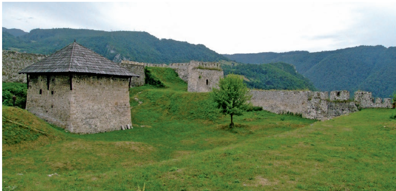
Sl. 3 Oстаци utvrde u Jajcu (snimio Ozren Blagec)