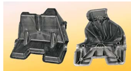
SLIKA 3. Otpresak načinjen postupkom IMF

IMF je postupak gospodarski opravdane velikoserijske izradbe visokozahtjevnih plastomernih hibridnih struktura namijenjenih potrebama zrakoplovne, svemirske i automobilske industrije. Radi se o kombiniranom postupku preoblikovanja i prablikovanja. Potrebno beskonačno, anizotropno ojačavalo u obliku tkanja povezano je s plastomerom. Na taj način pripremljeno i zagrijano tkanje zatim se zatvaranjem kalupa izvlači u potreban predoblik (faza preoblikovanja). Slijedi ubrizgavanje plastomera ojačanoga kratkim vlaknima (prablikovanje injekcijskim prešnjem). Postupak omogućuje daljnje integriranje, npr. injekcijsko prešanje plastomernih pjena ili injekcijsko ukrašavanje (IMD) radi postizanja površine A-klase. Na slici 3 prikazan je otpresak načinjen ovim postupkom.