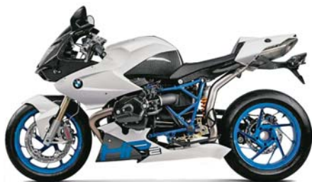
SLIKA 1. BMW HP 2 Sport

U kategoriji industrijsko dostignuće dodijeljene su dvije nagrade. Jednu je dobila tvrtka BMW za strukturni dio s integriranim funkcijama. Radi se o samonosećem repu motora BMW HP 2 Sport načinjenog od kompozita s ugljikovim vlaknima (slika 1).