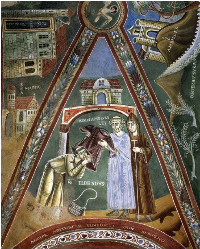
Fig. 1. Il monaco viene accolto nel monastero. Abbazia della Novalesa, cappella di S. Eldrado

tuiva un tratto caratterizzante, tanto da divenire uno degli elementi chiave dell'autorappresentazione degli stessi abati 7 .