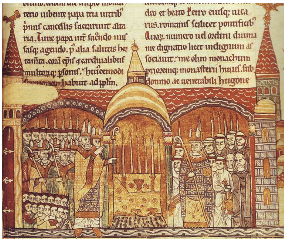
Fig.3. Urbano II consacra la chiesa di Cluny. Miniatura. Parigi. Biblioteca Nazionale (da completare)

non venisse praticata, perché strutture esterne provvedevano a dare ospitalità, a ricchi e a poveri, con modalità diverse. Il piano dell'abbazia di San Gallo, del IX secolo 43 , mostra come gli spazi riservati agli ospiti siano esterni al nucleo principale degli edifici e siano costituiti, anche in questo caso, da strutture distinte per l'accoglienza di pauperes e divites (Fig.2).