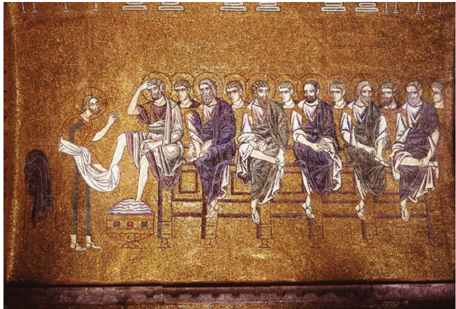
Fig. 4. Lavacro dei piedi. Venezia, Basilica di San Marco. Mosaico. Anonimo XI-XI secolo.

La funzione dei laici nella societas christiana , in particolare in relazione all'approccio al problema della povertà, non riguarda soltanto i modelli di spiritualità 51 (nei quali peraltro proprio il tema della santità legata alle opere di carità è centrale), ma tocca il ruolo che spettava ai duo genera christianorum nell'occuparsi dei bisogni dei pauperes , temi che emergono con particolare vivacità nell'età della riforma della Chiesa 52 . I grandi abati ebbero un forte ruolo nel convertire e condurre all'interno del monastero forze nuove, in particolare persone ricche e potenti. È nota la forte pressione, o addirittura la violenza, che alcuni personaggi (come san Romualdo) avrebbero esercitato nei confronti di coloro che vivevano una vita dissoluta all'esterno del monastero per tentarne la conversione. Ciò che mi pare interessante, nelle dinamiche che ben metteva in evidenza il Tellenbach 53 , è come la scelta di chiudersi all'interno delle mura del chiostro poteva però essere percepita anche come un tentativo di distogliere i laici dai loro obblighi nei confronti della società