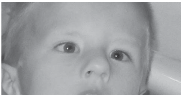
SLIKA 1. Konvergentni strabizam prije nošenja naočala

nja, bulbomotorika je otežana, a abdukcija oka nemoguća, što izaziva kliničku sliku konvergentnog strabizma. Iako se najčešće javljaju konvergentni i vertikalni strabizam, nedavno je opisan i divergentni strabizam u djece s MBS-om (10). Poremećaj bulbomotorike se često dijagnosticira u kasnijoj dojenačkoj dobi, jer se nemogućnost pokretanja očiju nadomješta okretanjem glave. Carta i sur. opisali su tri specifična poremećaja položaja očiju u bolesnika s MBS-om (8): oblik 1 (41% ispitanika) obuhvaća uredan položaj očiju u primarnom položaju (ortoforija) s potpunim deficitom abdukcije i adukcije, oblik 2 (50% ispitanika) je konvergentni strabizam s velikim kutom otklona te oblik 3, kad prevladava divergentni strabizam velikog kuta s tortikolisom, ali i vertikalnim strabizmom (9% ispitanika). Amaya i sur. opisuju seriju od 18 bolesnika s MBS-om od kojih samo troje ima vertikalni strabizam, a ostali imaju horizontalni otklon (konvergentni strabizam).