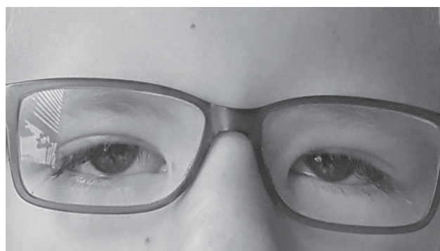
SLIKA 3. Nakon operacije

Okulomotorna disfunkcija ima ozbiljne posljedice za motorički i kognitivni razvoj kao i doživljaj okoline. Vidni sustav funkcionira tako da oštrina vida kazuje „što“ gledamo, a uredna funkcija bulbomotorike pokazuje „gdje“ je to što gledamo. Razvoj binokularnog vida je onemogućen, a time i orijentacija u prostoru, percepcija pokreta i motorička spretnost.