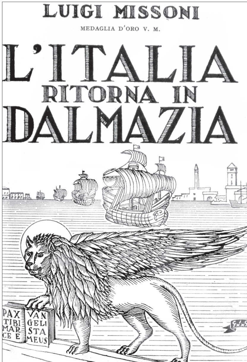
Naslovnica Missonijeve knjige o "povratku Italije u Dalmaciju" iz godine 1942. krasio je simbol mletačkog lava.