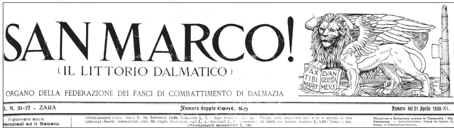
Zaglavlje zadarskog lista San Marco iz godine 1933.