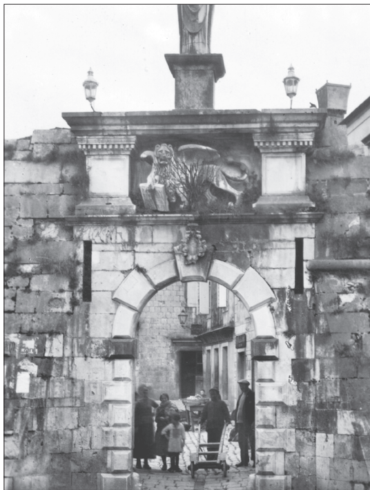
Mletački su lavovi do 1. prosinca 1932. stajali na najistaknutijim mjestima u gradu Trogiru. Među njima su bili i onaj na retablu Pravde u gradskoj loži iz godine 1473., djelo Nikole Firentica (slika gore, suvremena razglednica), te lav na kopnenim vratima (slika dolje, suvremena razglednica).