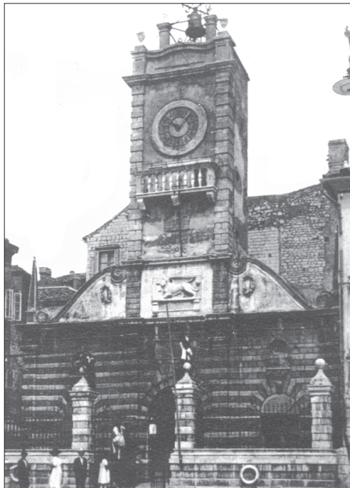
Reljef mletačkog lava postavljen je na toranj gradske straže u Zadru nedugo nakon uspostave talijanske vlasti (fotografija objavljena u albumu Ricordo di Zara d'Italia).