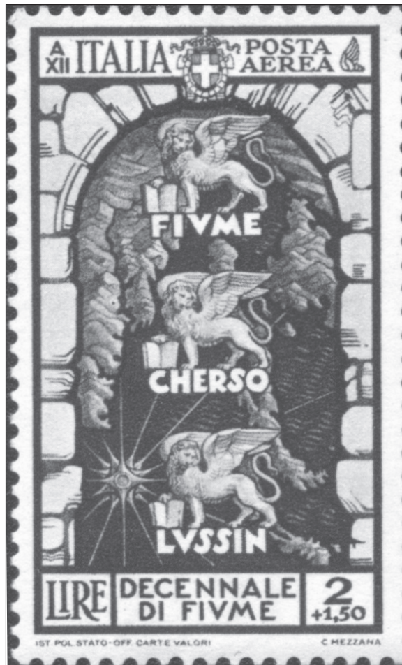
Mletački lavovi kao simboli talijanske vlasti na Kvarneru na poštanskoj marki iz godine 1934.