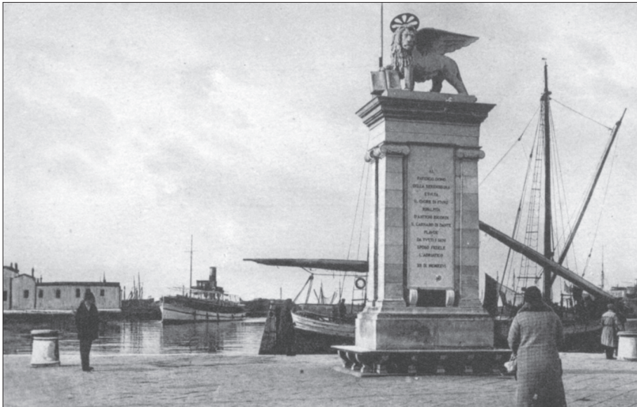
Mletački lav kojega je Venecija poklonila D'Annunzijevoj Rijeci postavljen je na spomenik, koji je u počast poginulih u Prvom svjetskom ratu podignut u riječkoj luci godine 1926. (suvremena razglednica).