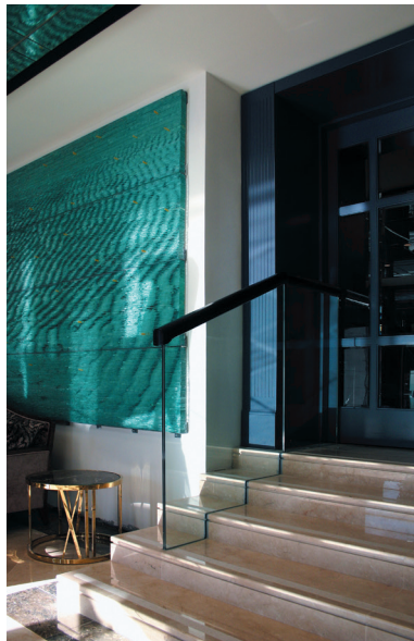
Hotel Park (E. Šverko), Hatzeov perivoj, Split U suglasju sa mogućnostima i filozofijom obrade predstavljena je posveta kamenu

Slijedom istog predloška dizajnirana je staklena ograda urezivanjem u kamene stube u Hotelu Park u Splitu: