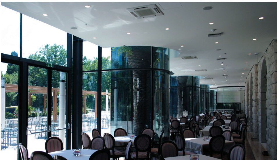
Hotel Park, Split Koncept vertikalnih planova rekonstrukcije i dogradnje: postojeći kameni zid, staklena stijena koja obgrljuje palmina debla, te drvena pergola (tikovina) na kamenom (dolit) popločanoj terasi