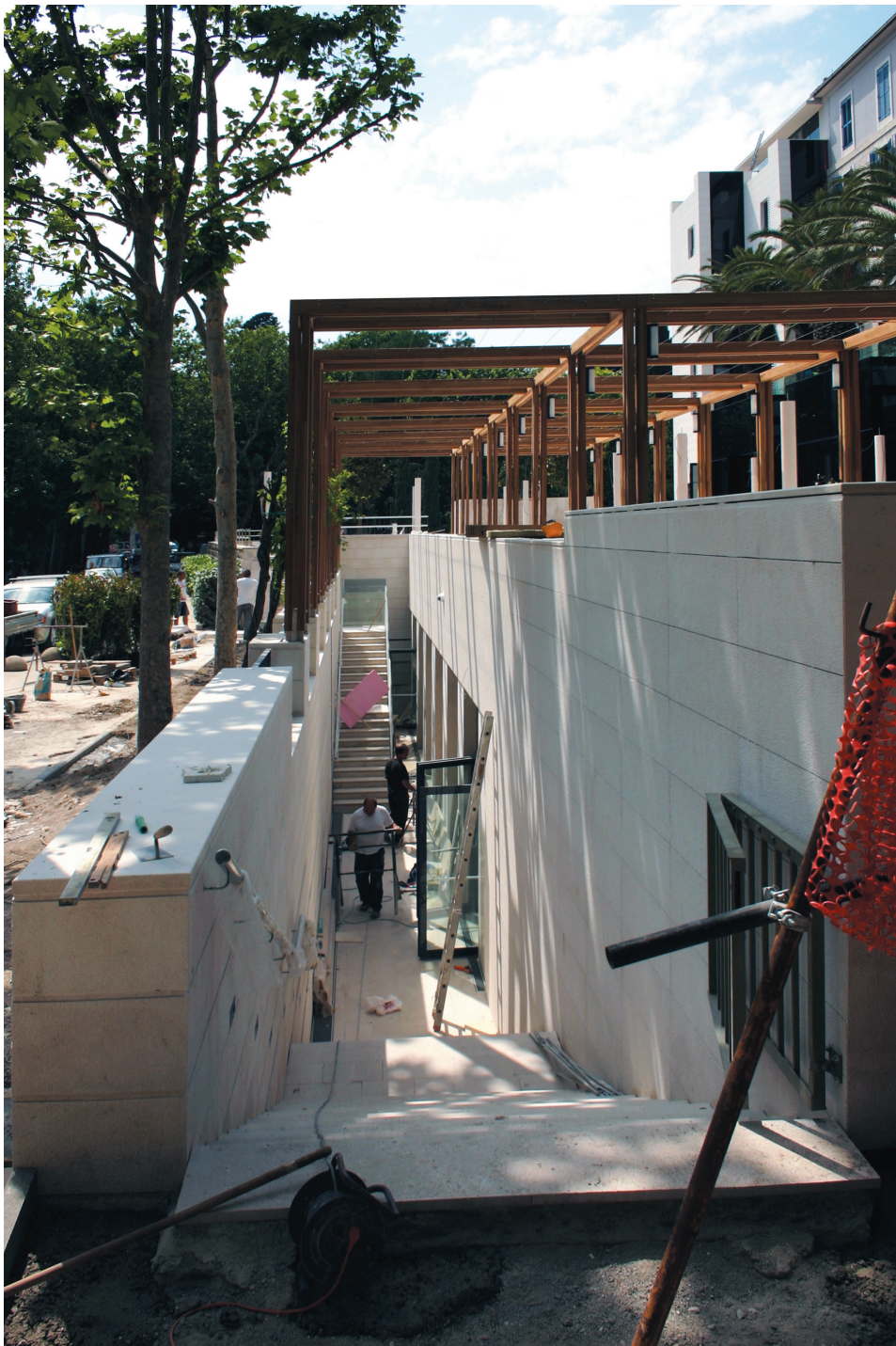
Hotel Park, Split Pogled na južni ulazni atrij u kongresnu dvoranu