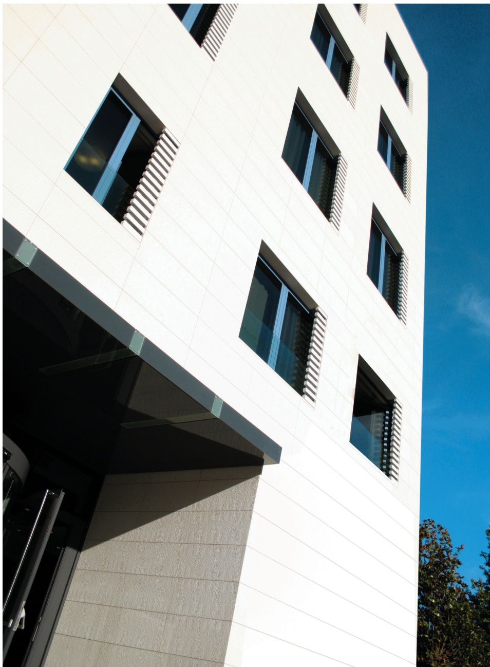
Hotel Park, Split Ulazni trijem

Dograđeni zapadni blok u cijelosti je obložen kamenim pločama (Veselje, deb. 4 cm), koje su, s već izvedenim uglovnim „špicadurama“, stizale sa Brača spremne za montažu, čemu je imala prethoditi fascinantno precizna izmjera.