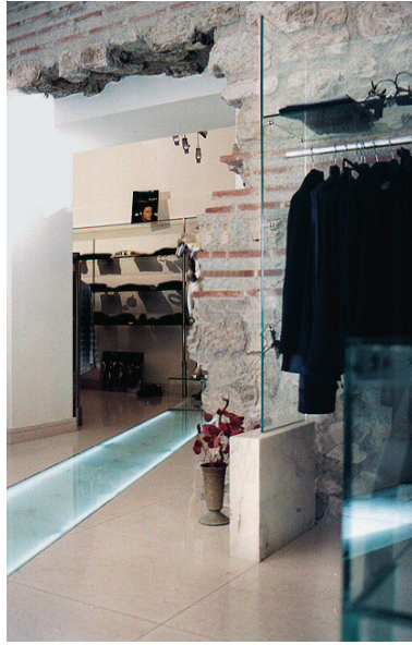
Boutique IT (E. Šverko), Poljana Kraljice Jelene, Split Brutalni sudar stakla i kamena, pojavnost na rubu nelagode

Slijedom istog predloška dizajnirana je staklena ograda urezivanjem u kamene stube u Hotelu Park u Splitu: