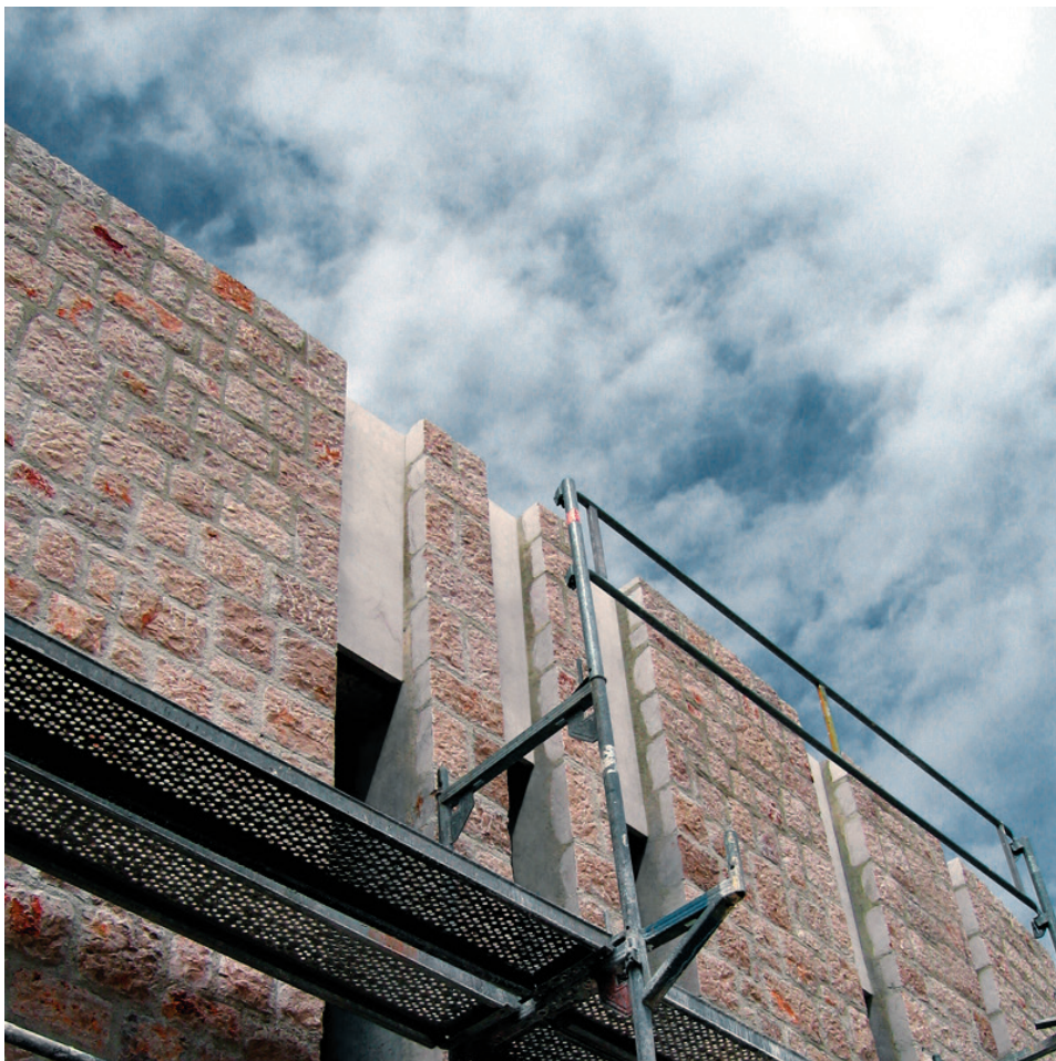
Crkva hrvatskih mučenika (G. Banić, E. Šverko), Čavoglave

Rezanje, kao tema koja nosi oblikovanje kamenog zida, prisutna je i u Crkvi hrvatskih mučenika u Čavoglavama: