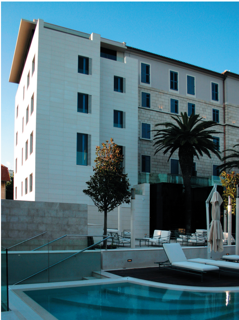
Hotel Park, Split Detalj južnog pročelja sa vanjskim bazenom

Nadogradnja nad postojećim gabaritom nije mogla podnijeti kamenu oblogu zbog nedostatne statičke nosivosti temelja. Planirano žbukanje kamenom žbukom s naglašenom zrnatom teksturom također nije realizirano s obzirom na to da propi-