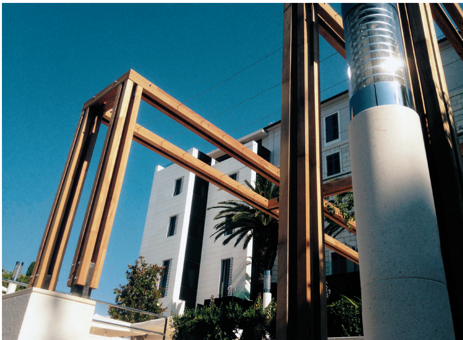
Hotel Park, Split Pogled sa ulice na južno pročelje na spoju starog i novog