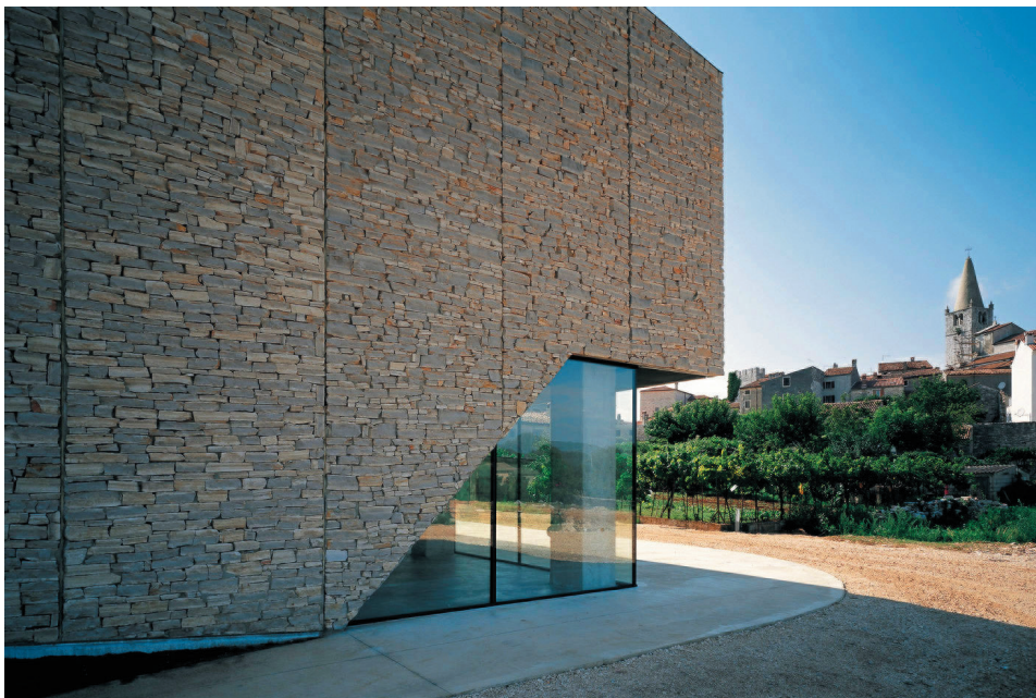
Sportska dvorana (31hd), Bale