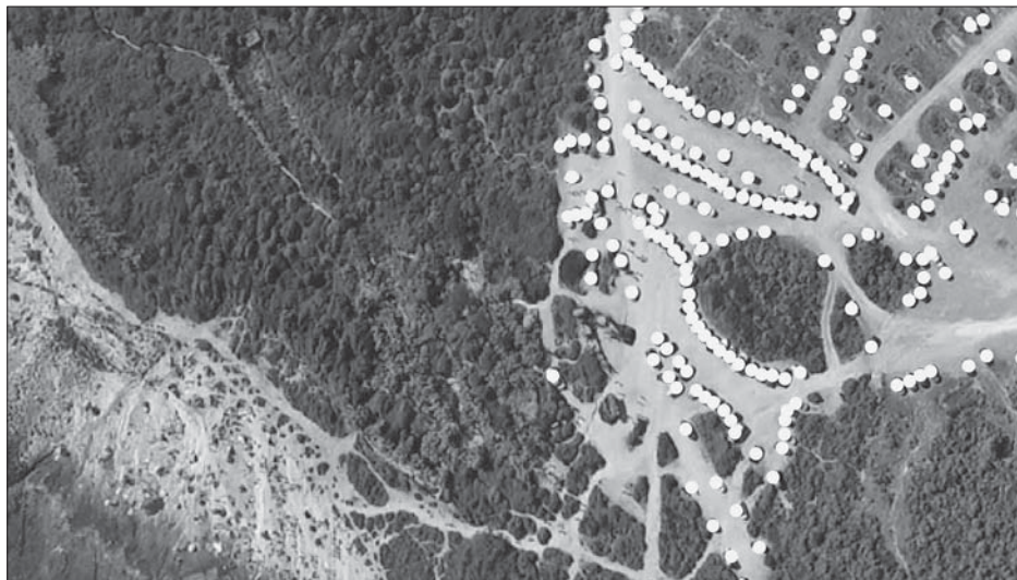
SL. 2. ZK DKiMA – BROJANJE PARKIRANIH VOZILA (PRIMJER: PREDJEL KRŠINE), POMOCU CAD PROGRAMA, NA SLIKAMA EKSTRAHIRANIM IZ VIDEOZAPISA NAPRAVLJENIH DRONOM

FIG. 2 ZK DKiMA – REGISTERED PARKED VEHICLES (EXAMPLE: KRŠINE AREA) BY MEANS OF A CAD PROGRAM IN THE PICTURES EXTRACTED FROM THE VIDEO MADE BY A DRONE