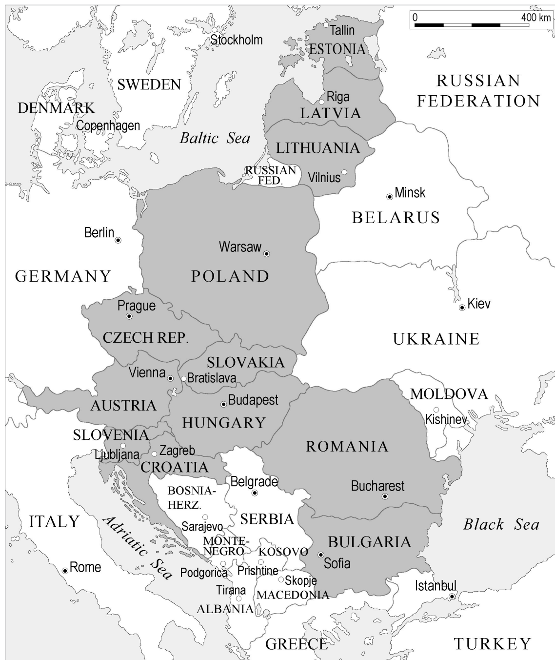
Fig. 1 The Three Seas Initiative member states Sl. 1. Države članice Inicijative Tri mora

Inicijativa triju mora: geografske odrednice, geopolitička utemeljenja i budući izazovi