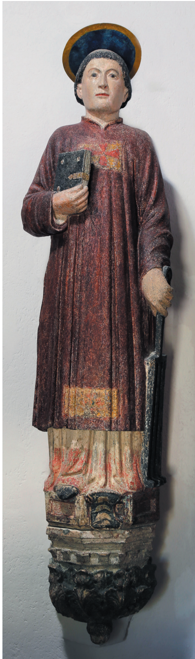
Nepoznati majstor, kip sv. Lovre sa ugla gradske vijećnice, danas u crkvi sv. Lovre na Pazdigradu