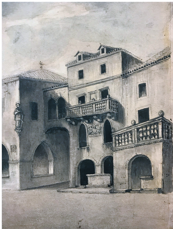
V. Andrić, Komunalna i Kneževa palača na trgu sv. Lovre (detalj)

ninu Jakovljevom Milanacu navodi na pomisao da je majstor već prije dolaska grada pod mletačku upravu radio u Splitu, kako je to već prije pretpostavio Cvito Fisković. 19