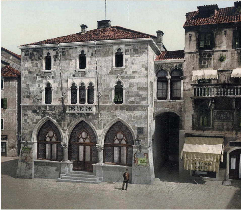
Stara gradska vijećnica i palača Karepić u Splitu, razglednica s početka 20. stoljeća

skih zidina, te kako im ova sadašnja koja se nalazi na plokati više nije pogodna, između ostalog zbog toga što se na toj pjaci održavaju brojne svjetovne manifestacije i sklapaju privatni poslovi čime se remeti sakralnost mjesta, a to onemogućuje kontemplaciju i molitvu. Navodni su prigovori Splićana zapravo prikrili pravu namjeru mletačke uprave, a to je proširenje kneževa dvora na gotovo polovicu glavnoga gradskog trga u čemu im je smetala stara crkva sv. Lovre jer se nalazila baš na mjestu ili u blizini budućeg gradilišta gradske lože. 7