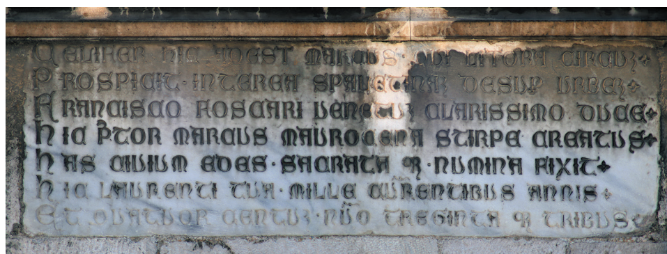
Natpis sa gradske lože u Splitu

nastalih poslije rušenja, od kojih je najpoznatiji i najdetaljniji lavirani tuš nepoznata autora iz arhiva Konzervatorskog odjela u Splitu. 22 U tom arhivu čuva se i tlocrt Kneževe i Općinske palače i triju zgrada u njihovoj pozadini izrađen 16. travnja 1821. godine, neposredno prije rušenja sklopa. 23 Iz te dokumentacije moguće je potpuno točno grafički rekonstruirati dvor i njegov neposredni okoliš.