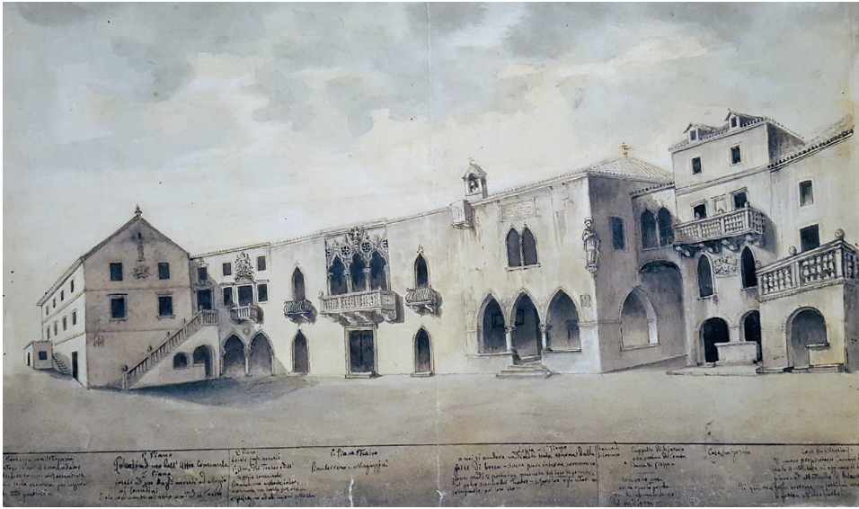
Komunalna i kneževa palača na Trgu sv. Lovre u Splitu (srušena početkom 19. st.), V. Andrić, akvarel, Konzervatorski arhiv Split, list 153-1

u prilog tezi Predraga Markovića kako je Bonino Milanac bio protomajstor i arhitekt, a ne samo skulptor. 12