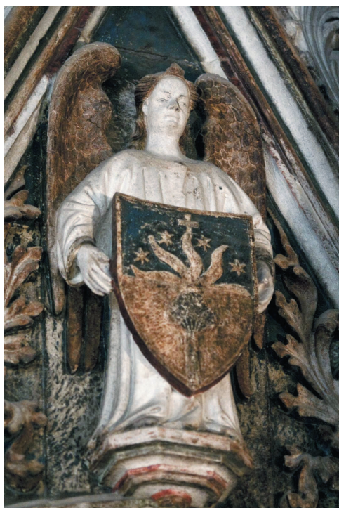
Grb Petra Diškovića na ciboriju kapele sv. Dujma

da je ciborij kapele bio dovršen još za njegova života, a time, dakako, i gotovo cijela kapela. Anđeo štitonoša na sjevernom teguriju drži grb pripadnika mletačke plemićke obitelji Gabrielli, splitskog kneza (1425. – 1428.) iz tog vremena.