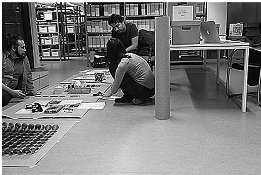
sl.4. Gamulin, Sevšek - Mercic Picelj: Iz Arhiva i knjižnice Ivana Picelja (analiza arhive i prva grupiranja tema prije oblikovanja postava)

i interes koji nastojimo pobuditi u posjetitelja, najčešće ovise isključivo o njihovoj kontekstualizaciji i mizansceni. Premda su, primjerice, za prosječnog posjetitelja svi ulomci keramike ili tradicionalni alati u svim postavama koje posjećuje gotovo identični, ako uspijemo prikazati zašto su upravo ti iloženi baš na tome mjestu i zašto upravo u tom konkretnom trenutku zaslužuju pozornost, vjerojatno smo time zajednički stvorili vrijedan i specifičan doživljaj u moru sve brojnijih muzejskih postava koji u taktikama privlačenja posjetitelja postaju međusobno sve kompetitivniji.