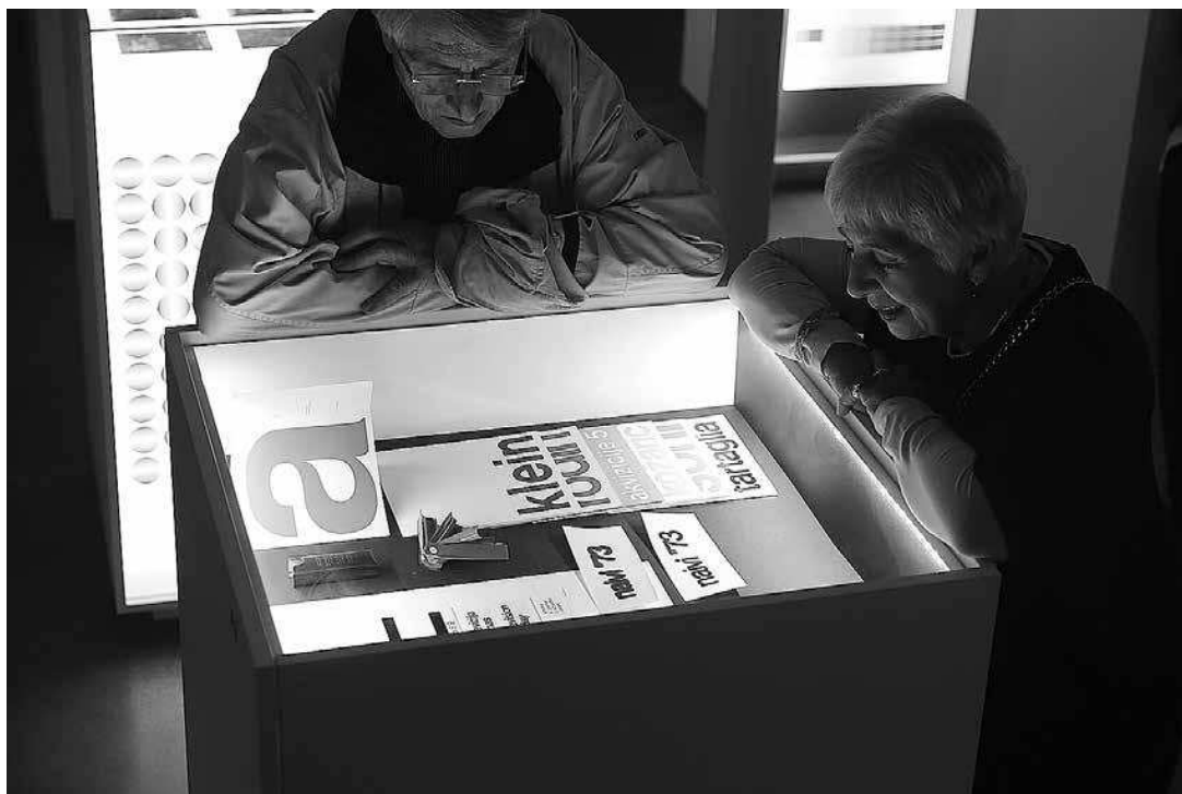
sl.5. Gamulin, Sevšek - Mercic Picelj: Iz Arhiva i knjižnice Ivana Picelja (višenamjenski objekti za izložbu i arhivu)

primoranosti na primjenu suvremenih tehnologija osobito nas intrigira. Ne zadržimo se od primjene tehnologije, štoviše, no čini nam se da osim visoke inicijalne cijene ona donosi i zamke brzog zastarijevanja i svojevrsne tehnološke utrke za postizanjem učinaka koji su često više fascinacija novim negoli stvarno unapređenje u usporedbi s klasičnim prikazivačkim strategijama. Gdje god je moguće, pokušavamo se koristiti isključivo analognim tehnologijama ili kombinacijom analognih i digitalnih tehnologija te fizičkih predmeta. Na taj je način moguće stvoriti neočekivane ambijente i narativne situacije koje posjetitelj nema priliku drugdje iskusiti i koje trajno ostaju u memoriji, što, nažalost, ne vrijedi za sve zastupljeniju digitalnu tehnologiju, pogotovo među mlađim posjetiteljima koji izrazito brzo apsorbiraju i još brže odbacuju paradigme konzumiranja sadržaja koji se nude na tržištu. Susret pak s analognim ili nestandardnim tehnologijama pomiče posjetitelje iz očekivanih odnosa prema sadržaju, dodatno stvarajući posvećenu atmosferu unutar muzeja.