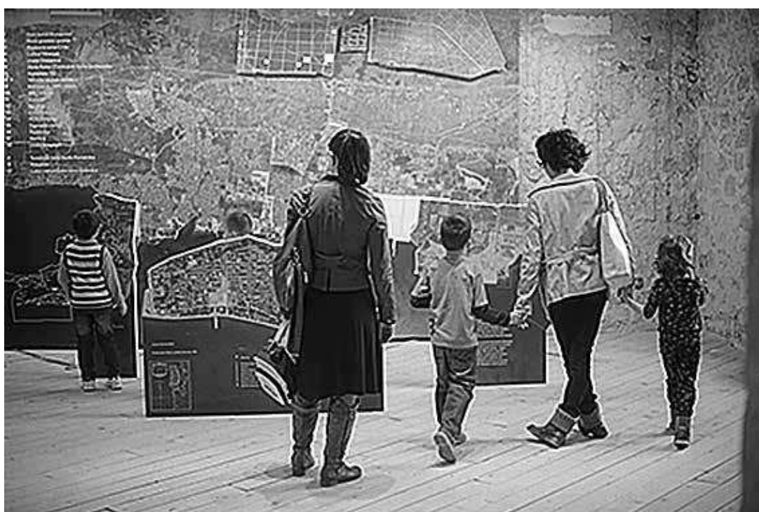
sl.2. Gamulin, Mrduljaš, Sevšek - Prostor su-djelovanja (izložba kao karta odnosno županija u mjerilu čovjeka)