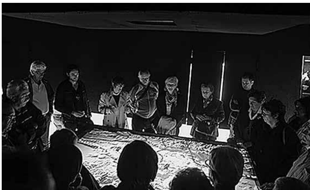
sl.8. Gamulin, Sevšek - Memorijalna zbirka Lipa pamtí (optički uređaj, projektirani alat za izlaganje dostupne fotografske dokumentacije napada na mjesto Lipa)