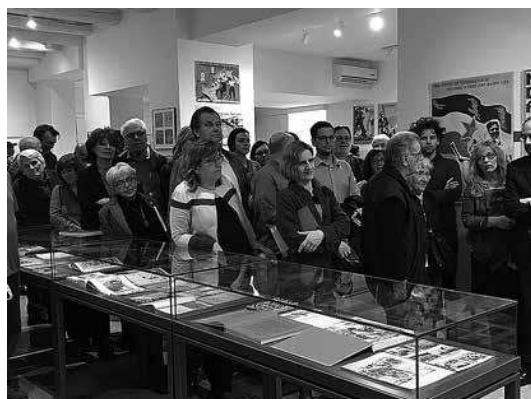
sl.18.- 23. Omladinske radne akcije – dizajn ideologije, KIC, Galerija na katu, 2017.