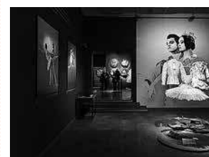
sl.11.-12. Balet i strast – donacija Jelka Yureshe, Muzej za umjetnost i obrt, Zagreb, 2017.–2018.