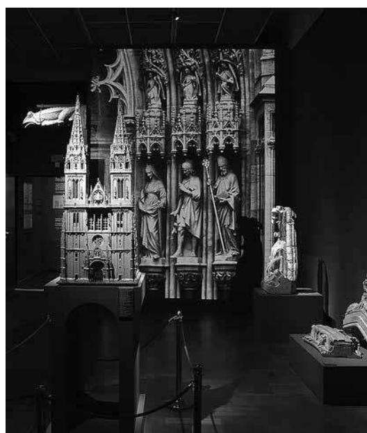
sl.1.-7. Herman Bollé – graditelj hrvatske metropole, Muzej za umjetnost i obrt, 2015.

tonske točke prepoznatljivosti gradske vizure. Izložba je postavljena u zgradi Muzeja (i škole) čiji je Bollé autor, unutar prostora koji je ustanovio te institucije u kojoj je djelovao. Osim arhitekture (crteža, tlocrta, skica, fotografija, projekcija), izloženi su predmeti primijenjene umjetnosti različitih namjena i formata; uporabni predmeti poput čaša i odjeće, dijelovi soba, stjegovi, dijelovi ograda i sl., kao i kameni segmenti zagrebačke prvostolne crkve i drugih crkava – crjepovi, dijelovi tornjeva, vodorige. Ti originalni materijali dopremljeni su i odabrani s terena koji smo obišli s autorom izložbe i tehničkom službom Muzeja. Zbog težine i aplikacije materijala s tehničkom je službom trebalo osmisliti način izlaganja na željenim mjestima koja su udovoljavala zahtjevima o sigurnosti posjetitelja u sklopu željene vizure i estetike izložbe. Autor koncepcije izložbe Dragan Damjanović zamislio je osnovni scenarij (priču) izložbe, koji je djelomice izmijenio u dogovoru s nama i kustosima Muzeja. U pričanju i predstavljanju tako kompleksne priče koja je počinjala zagrebačkim potresom 1880., a završila