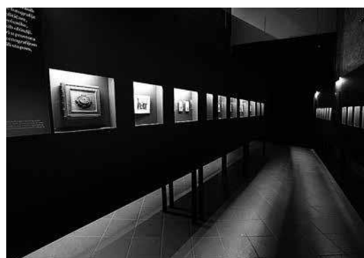
sl.8.-10. Pommer 1856 / Gojević 2016: Fotografske slike naših narodnih spisateljâh, Muzej grada Zagreba, 2017. – 2018.

pričom o gradnji groblja Mirogoja pomogla nam je činjenica da smo prije toga radili na monografiji o Hermanu Bolléu ( Leykam international , MUO, 2013., 680 str.).