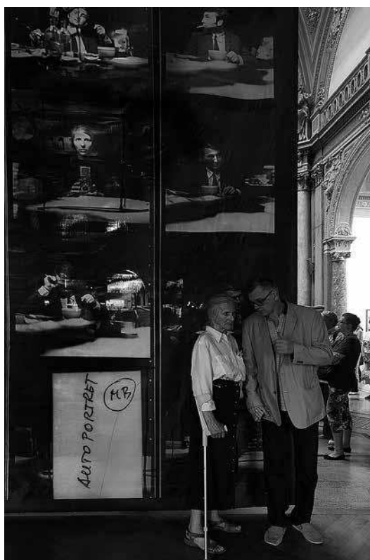
sl.13.-17. Nepoznati Zagreb Marije Braut, Umjetnički paviljon, Zagreb, 2014.