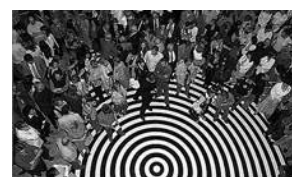
Umjetnost uvjeravanja – 170 godina oglašavanja u Hrvatskoj 1835.-2005., Muzej za umjetnost i obrt, Zagreb, 2006.

Ključna je interaktivnost postava, tj. komunikacija izložaka s posjetiteljem. Posjetitelj mora biti "uvučen" u priču, mora doživjeti genius loci (duh mjesta). Svi mi najbolje pamtimo i reagiramo na ono što osjetimo vlastitim iskustvom, u interakciji s okolinom koja nas okružuje. Ukratko, postav treba angažirati što više osjetila.