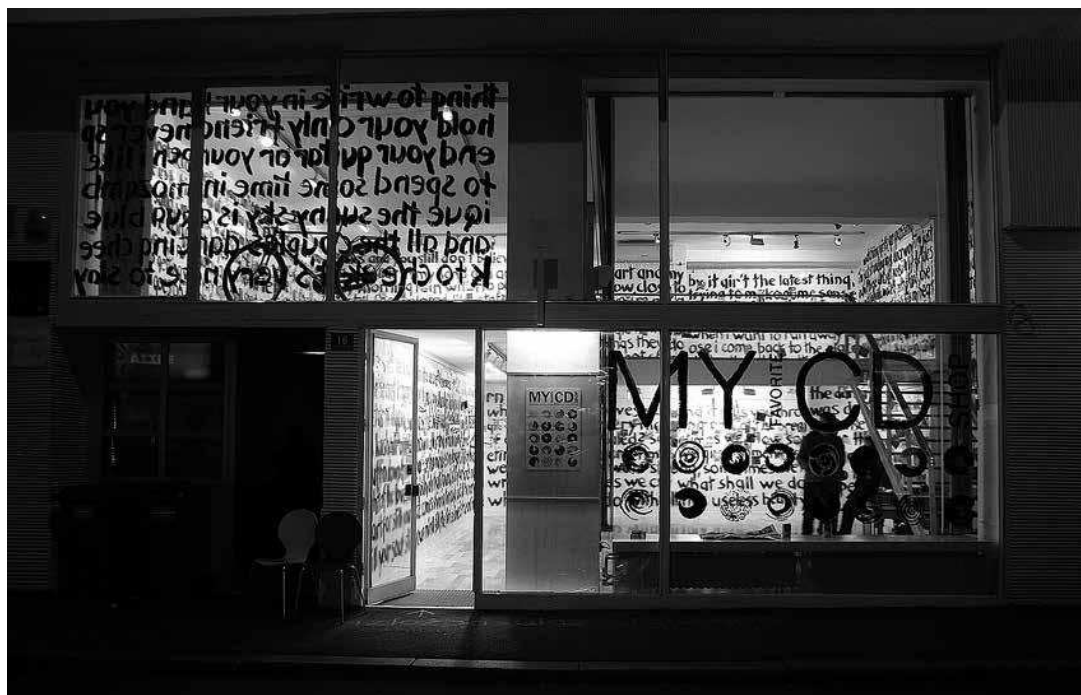
My Favorite CD Shop Studio Rašić+Vrabec Galerija Forum, Zagreb, 2012.

V.V. i M.R.: Zahtjevnije je raditi s povijesnim eksponatima koji imaju specifična pravila izlaganja što ih zahtijeva struka radi očuvanja građe. U Muzeju za umjetnost i obrt radili smo vrlo zahtjevnu izložbu – Od Klovića i Rembrandta do Warhola i Picelja , na kojoj je bilo više od tisuću vrijednih povijesnih izložaka, među kojima je bila većina starih grafika, a one su morale biti osvijetljene na određeni način te izložene u odgovarajućim mikroklimatskim uvjetima.