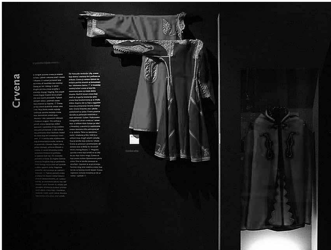
sl.1.-4. Moć boja (u suradnji s Branimirom Paškvanom) Etnografski muzej Zagreb, Zagreb, 2010.

IM 48, 2017. TEMA BROJA TOPIC OF THIS VOLUME