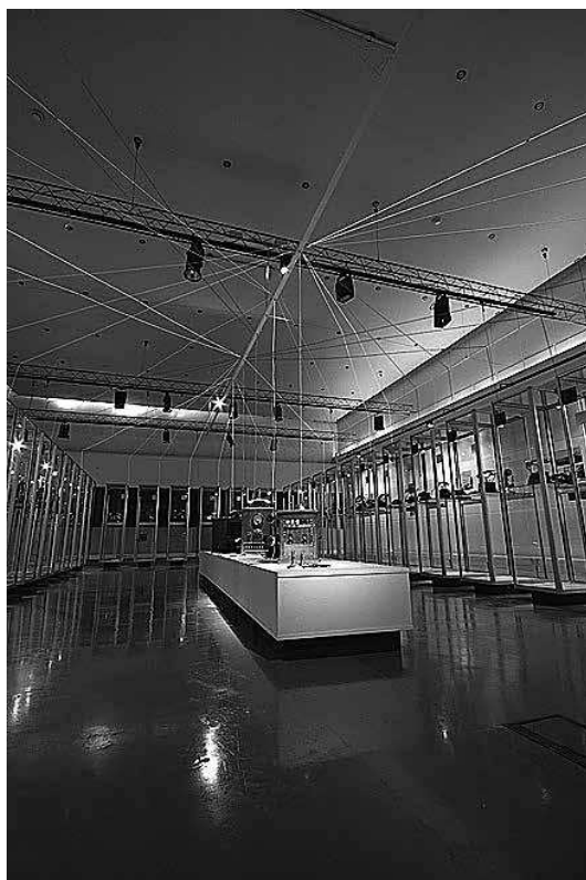
sl.9. Pisači strojevi HT muzej, Zagreb, 2009.