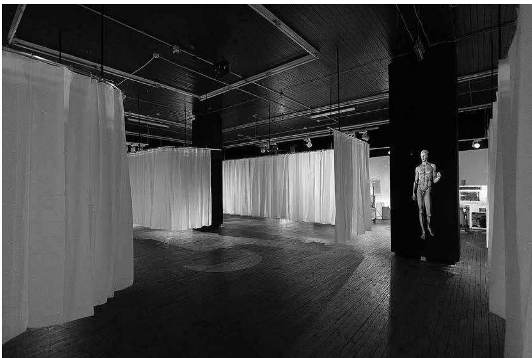
sl.13. Tehnika i medicina Tehnički muzej 'Nikola Tesla' Zagreb, 2018.