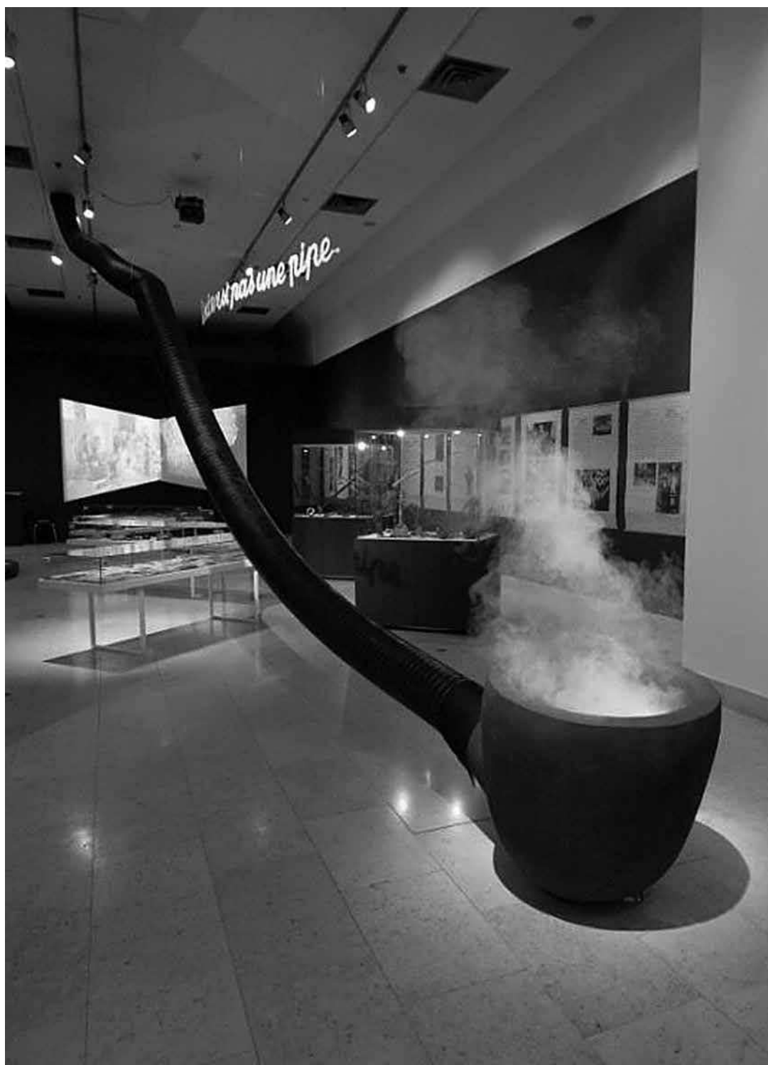
sl.5. DIM, Priča o duhanu Etnografski muzej Zagreb Zagreb, 2015.

vizije te došli do optimalnog rješenja koje naručitelj razumije, tj. prihvaća.