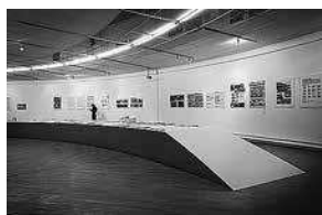
sl. 10.-12. Zgraf 11. međunarodna izložba grafičkog dizajna i vizualnih komunikacija, Dom HDLU, 2012.

kvatnu tehničku potporu, koja je presudna za takav tip dizajna. Sama tehnologija često se nekritički upotrebljava za dekorativne ili reklamne svrhe, bez dizajnerskog promišljanja i povezanosti sa sadržajem, što izložbe čini samo još plošnjijima.