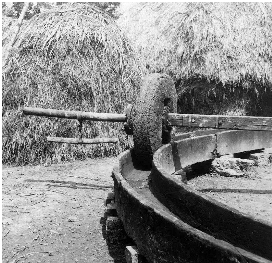
sl.2. Valovi i kameni kotač za usitnjavanje voća, iziomača iz Male Kopanice, Muzej Brodskog Posavlja, FE3646.

povlače konji obilazeći oko valova. Usitnjeno se voće kupi drvenim lopatama u drvene posude i nosi u prešu – u drugi dio naprave.