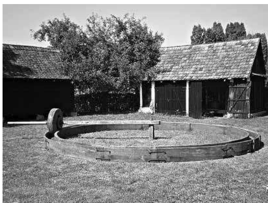
sl.3. Ižimača iz Beravaca, Muzej Brodskog Posavlja, FE963

Dokumentirajući stanje ižimače u Beravcima u sklopu sagledavanja stanja etnoparkova Hrvatske, zaključeno je kako su hrastovi valovi dotrajali te se teško mogu složiti u pravilan krug na dvorištu, što je dovelo u pitanje mogućnost daljnjeg održavanja folklorne priredbe. Drvo je kao materijal uglavnom zastupljeno na svim