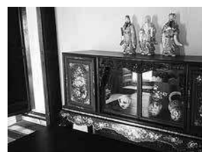
sl.1.-8. Hanoi Ancient House, Hanoi, Vijetnam

za staklenu bocu koje su korištene za mučenje zatvorenica, zatim oprema za davanje elektroškova i limena bačva u koju su zatvarani pojedini zatvorenici.