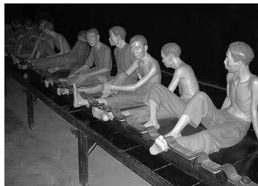
sl.9.-14. Zatvorski muzej Hoa Lo, Hanoi, Vijetnam

Posjetitelji koji napuštaju E-blok i kreću prema američkoj sekciji zatvora prolaze dvorištem u kojemu mogu vidjeti originalne dijelove tunela što su ga 1945. prokopali vijetnamski politički zatvorenici uspješno organiziravši bijeg sto zatvorenika.