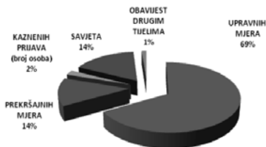
STRUKTURA PODUZETIH INSpeKCIJSKIH MJERA PREMA POSLODAVCIMA U PODRUČJU ZAŠTITE NA RADU 2013. g.