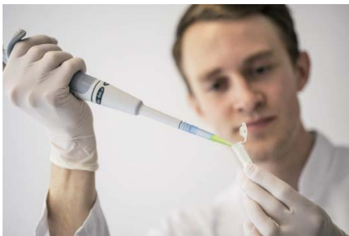
Sl.1 U Institutima Hohenstein razvijeni su pouzdani postupci ispitivanja

U Institutima Hohenstein razvijeni su pouzdani postupci utvrđivanja organskog pamuka. Radi se o ispitivanjima GMO promjena na pamuku. Ispitivanja se mogu provesti na svim od pamuka proizvedenim oblicima, od sirovog pamučnog vlakna, pređa, tkanina, pletiva, do gotove odjeće, sl.1 i 2.