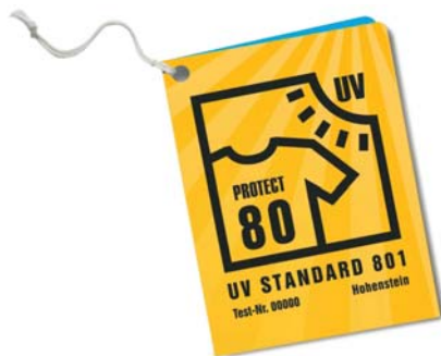
Sl.3 Oznaka za zaštitnu odjeću s faktorom 80 prema UV STANDARDU 801 Instituta Hohenstein

Činjenica je da je Sunce izvor života. Ali previše izlaganje Sunčevom zračenju je štetno. Ultraljubičaste (UV) zrake mogu uzrokovati trajna oštećenja vida i kože. Ovisno o tipu kože, oštećenje je vidljivo prije ili kasnije. S druge pak strane, izlaganjem Suncu ljudski organizam stvara vitamin D koji je važan za razvoj kostiju. Poznato je da je zaštita dojenčadi i male djece vrlo mala ili je uopće nema pa ih se smije vrlo ograničeno izlagati