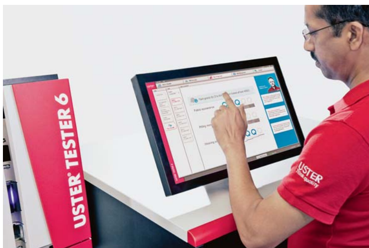
Sl.1 Provjera gradiranja pređe na Centru za potpuno ispitivanje pređa - Total Testing Center uređaja USTER® TESTER 6

Korelacija između ocjena otpornosti na piling koje su određene prema Assitant Q i ocjena određenih ispitivanjima pilinga bile su impresivne jer