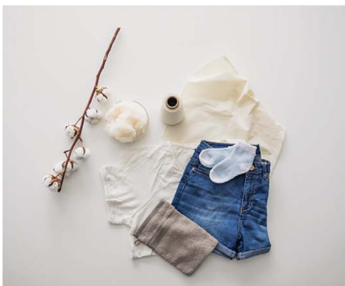
Sl.2 Pamuk vlakno široke primjene za razne proizvode