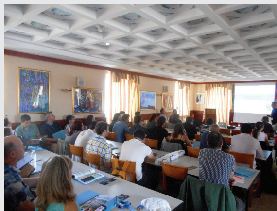
Slika 2 – Plenarno predavanje profesora Roberta Konrata iz Austrije pod naslovom “NMR Reveals Order in Disordered Proteins”