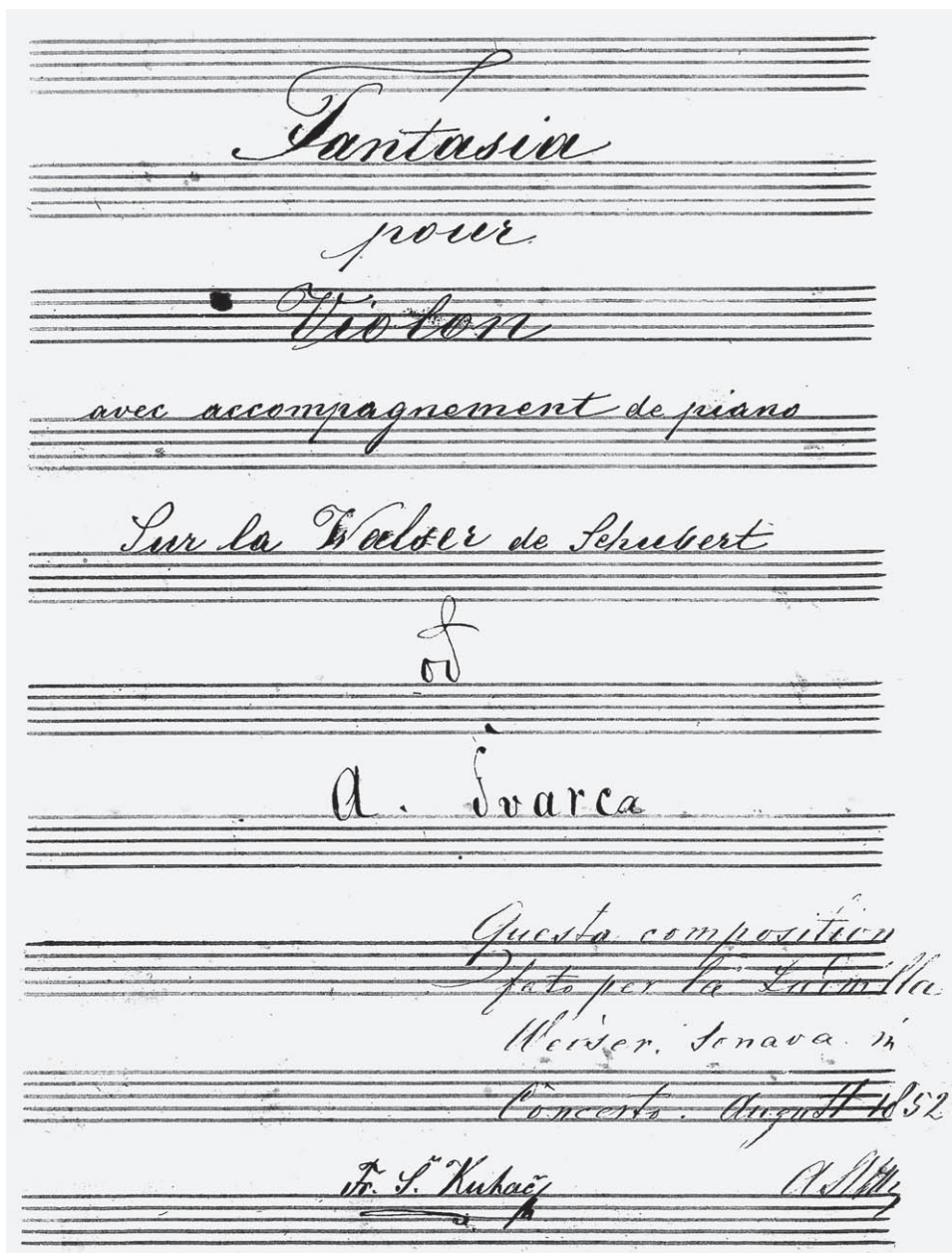
Sl. 2: Skladba Antuna Schwarz za Ludmillu Weiser 1852. (NSK)