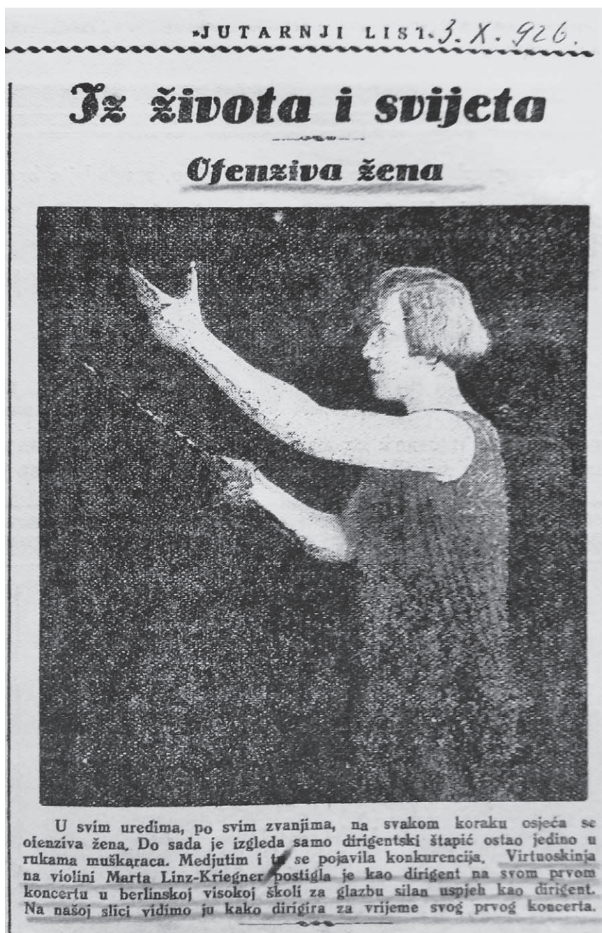
Sl. 5: Ofenziva žena, Jutarnji list , 3. 10. 1926.