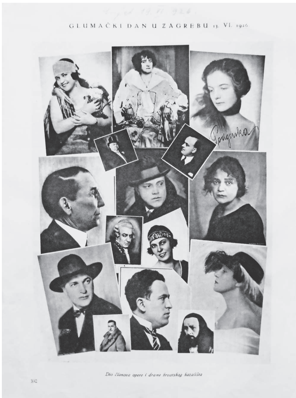
Sl. 2: Glumački dan u Zagrebu, Svijet , 19. 6. 1926.