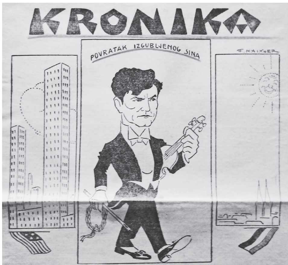
Sl. 7: Povratak izgubljenog sina, Večer , 2. 10. 1926.