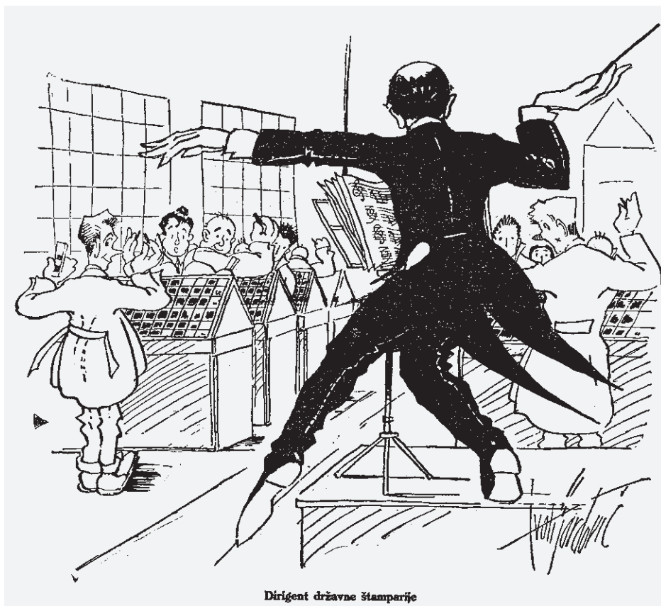
Dirigent državne štamparije