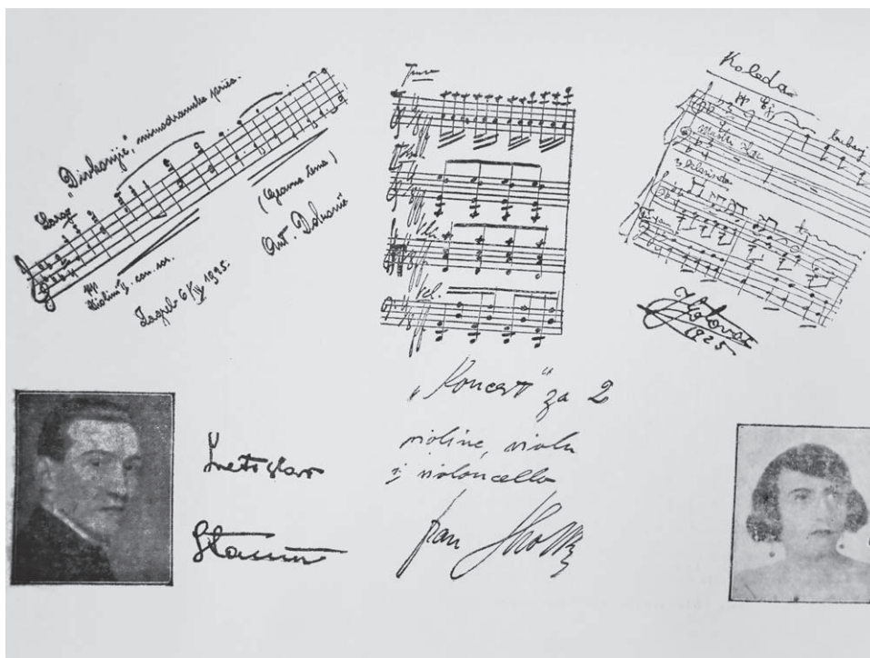
Sl. 8: Musiker Autogramme, Der Morgen , 11. 4. 1925.