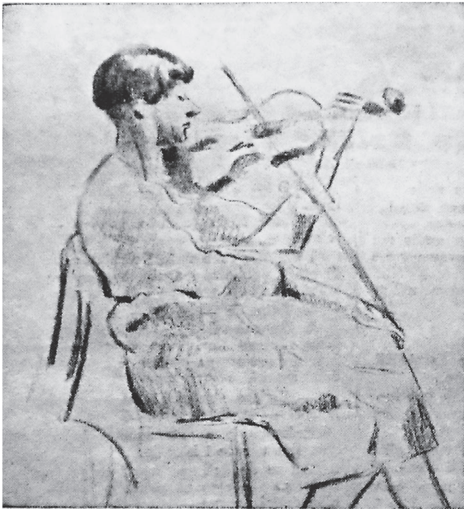
Sl. 3: Stogodišnjica Hrvatskog glazbenog zavoda. Tipovi iz orkestra, Jutarnji list , 25. 11. 1926.