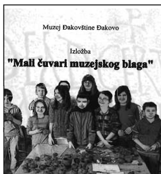
Branka Uzelac: Mali čuvari muzejskog blaga (katalog)