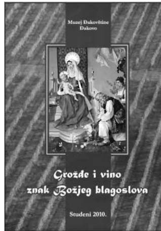
Skupina autora: Grožđe i vino znak Božjeg