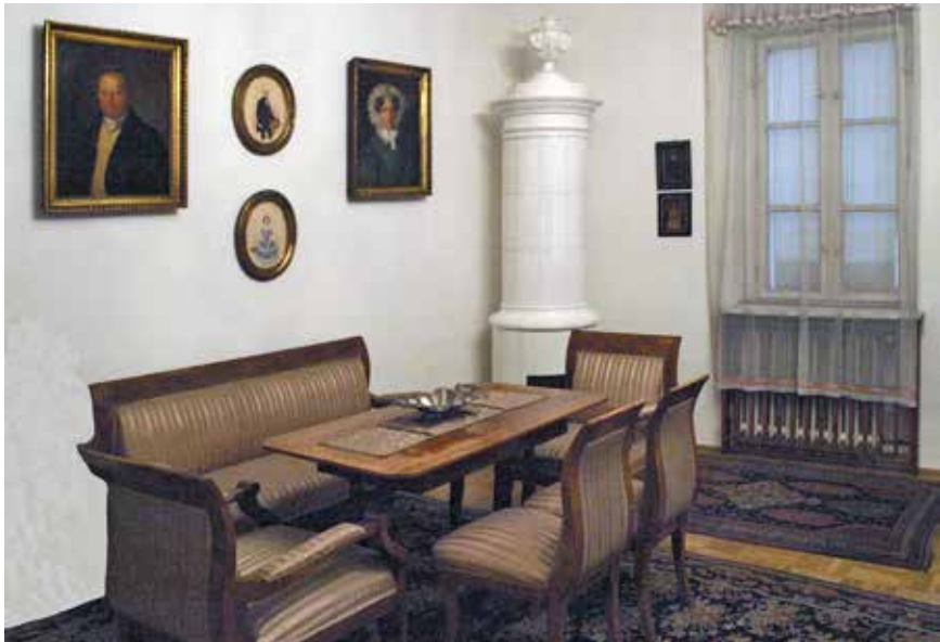
Memorijalna soba posvećena Semmelweisu u njegovoj rodnoj kući u Budimpešti, danas Povijesno-medicinskom muzeju nazvanom njegovim imenom. Semmelweis Memorial Room in his hometown Budapest, today the Medical History Museum named after him.