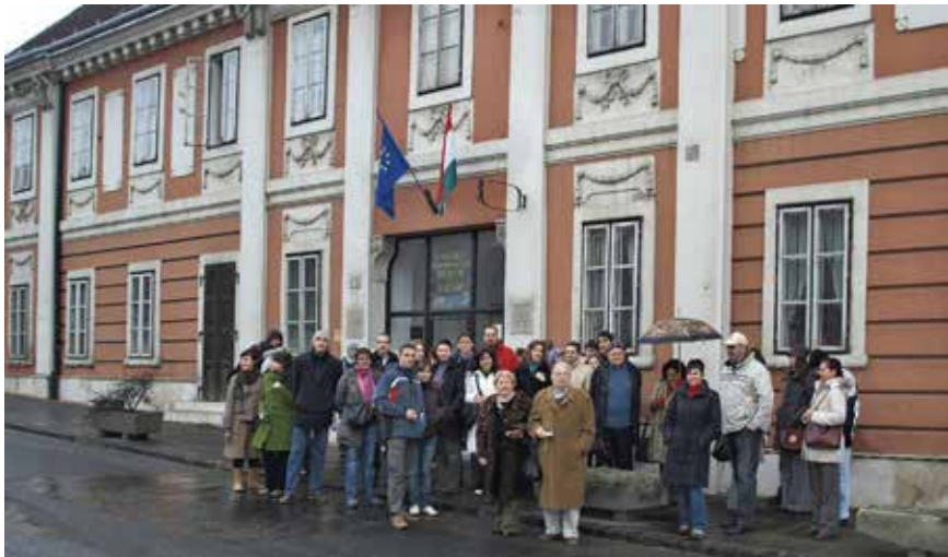
Studenti Medicinskog fakulteta Rijeka i članovi Hrvatskoga znanstvenog društva za povijest zdravstvene kulture pred Semelweisovim povijesno-medicinskim muzejom u Budimpešti 2008. The students of the Faculty of Medicine, University of Rijeka and the members of the Croatian Scientific Society for the History of Health Culture in front of the Semmelweis Museum of Medical History in Budapest, 2008.