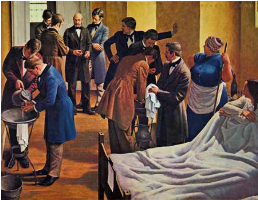
Robert Thom. Semmelweis – branitelj roditelja

Robert Thom. Semmelweis – Defender of Motherhood