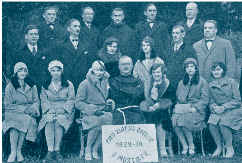
Pjevački zbor sv. Cecilije iz 1929. godine u Mostaru.

skom inteligencijom. Ubrzo je uvidio da je posao oko ovakvoga zbora nesiguran i nestalan. God. 1926. ukida se pjevanje u preparandiji, te s tim i ovaj zbor definitivno prestaje s radom. Fra Vatroslavu je preostalo jedino rješenje a to je prikupljanje oko sebe samo inteligencije koja mu se ovoga puta drage volje odaziva. Po želji članova zbor s vremenom od nestalnoga postaje stalni Cecilijanski zbor, zbor u kojem se radi sustavno. Tako se fra Vatroslavu ispunila želja za kojom je čeznuo čitavo vrijeme svoga rada. Zboru su data pravila koja su 29. svibnja 1929. sastavljena prema pravilima matice u Zagrebu. Iste godine potvrdila ih je i država (Sveta Cecilija, 1931., svz. 4, str. 135). Tako se ova godina smatra godinom osnutka mješovitog zbora Sv. Cecilije, tj. današnjega zbora župne crkve sv. Petra i Pavla u Mostaru.