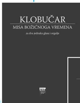
ISMN M-9013558-1-1 I. izdanje, Zagreb, 2004. 23x30 cm, 20 str., broširano