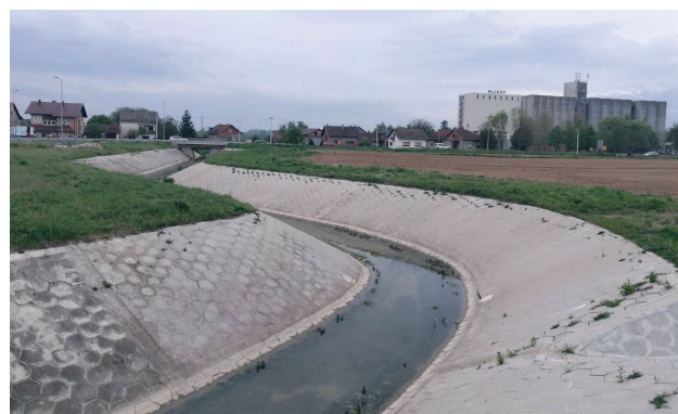
Slika 2: Primjeri korištenja šesterokutne prizme u praksi – za oblaganje otvorenih kanala

Odabrani element služi za oblaganje pokosa kanala (slika 2), ali obzirom na svoju izuzetnu čvrstoću i visinu pogoduje i kao element za popločavanje teško opterećenih prometnica, brodskih pristaništa i javnih parkirališta. Uobičajeno se izrađuje u dvije visine (10 i 20 cm), a s obzirom na ograničene količine dostupnog pepela, za provođenje pilot projekta odabrana je prizma s visinom 10 cm, isključivo zbog manjih potrebnih količina pepela.