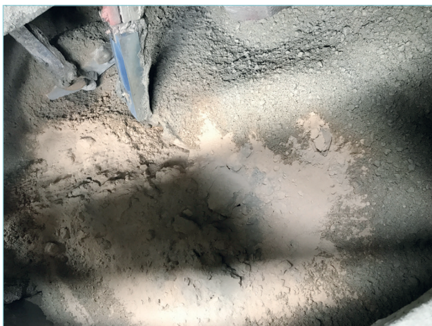
Slika 1: Dodavanje pepela u postupku miješanja betona za izradu šesterokutnih prizmi

Pri spravljanju betona korišten je miješani portlandski cement CEM II/B-M (S-V) 42.5N, prirodni i drobljeni agregat, aditiv te vodovodna voda. Mješavine su pripravljene u automatiziranoj miješalici uobičajenim postupkom koji se koristi u pogonu tvrtke Beton Lučko d.o.o. u količini od 0.5 m 3 (što je bilo dovoljno za proizvodnju 25 šesterokutnih prizmi sa svakim od korištenih pepela). Svaki od pepela korišten je kao zamjena za 10 % cementa (slika 1) u proizvodnji odabranog betonskog elementa – šesterokutne prizme. Beton je, potom, uz vibriranje, hidrauličkom prešom ugrađen u standardne kalupe. Oblikovani betonski elementi ostavljeni su da dozrijevaju u okolišnim uvjetima tijekom 28 dana.