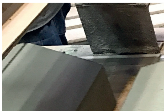
Slika 5: Betonski elementi (šesterokutna prizma) proizvedeni u sklopu pilot projekta s 10 %-tnim udjelom zamjene cementa pepelom

Na osnovi provedenih ispitivanja može se zaključiti da eksperimentalne šesterokutne prizme s 10 % zamjene cementa pepelom iz mulja s UPOV-a zadovoljavaju sve fizikalne i mehaničke zahtjeve.