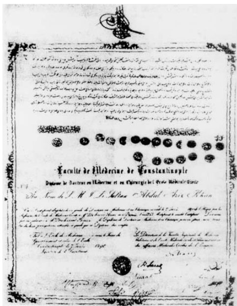
Slika 2. Faksimil diplome Mehmeda Sami Šerbića

Autori zahvaljuju gospodama Šadi Ibrahimagić i Behiji Sijerčić na pomoći prilikom pripreme članka.