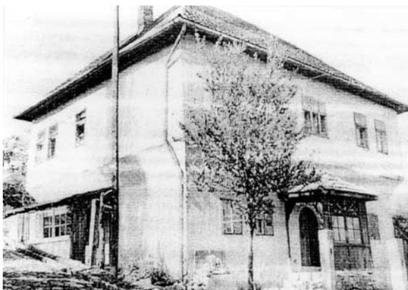
Slika 1. Hastahana - prva bolnica u Tuzli