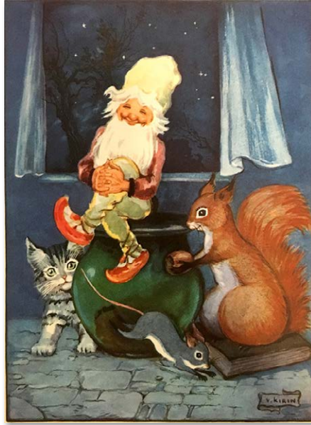
Sl. 6. Kirin, 1956.