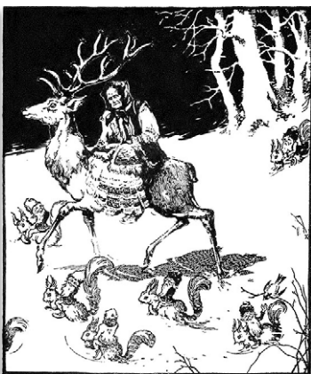
SI. 4. Kirin, 1922. Fig. 4. Kirin, 1922