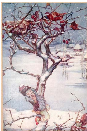
SI. 3. Kirin, 1923. Fig. 3. Kirin, 1923

2. Upotreba postojećih motiva u novome okruženju (SI. 3, 4 i 5). Iz navedenih se primjera može vidjeti kako su dvije postojeće ilustracije iskorištene za izradu nove, pri čemu se crno-bijela ilustracija pojavljuje u novome, obojenome ruhu. Također, usporedimo li postojeću ilustraciju u boji s novonastalom, ponovno možemo zaključiti kako se uporabom čistih tonova boje i jačih kontrasta želi postići „dinamičnija“ ilustracija, ali također se stječe dojam da kompozicijski nova ilustracija „pati“ od straha od neispunjenoga prostora što se rješava spajanjem motiva i dodavanjem likova.