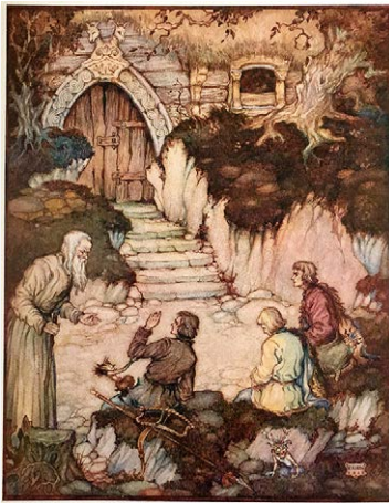
Sl. 1. Kirin, 1922.* Fig. 1. Kirin, 1922**

Iz Tablice 1 očigledno je da je tendencija u slikovnici bila povećati broj ilustracija, posebice onih u boji, a promijenjena je i veličina ilustracije kako bi svojim dimenzijama odgovarala četvrtini meko ukoričene slikovnice. Broj ilustracija diktiran je grafičkim izgledom knjige: listanje slikovnice trebalo je imati ujednačen ritam izmjene stranice teksta i oslikane stranice što je i postignuto, osim na središnjem listu, gdje nisu otisnute ilustracije (zbog presavijanja tiskarskoga arka). No, takav unaprijed određen ritam izmjene ilustracije i teksta doveo je do velikih kašnjenja ilustracije za tekstom u pripovjednome slijedu.