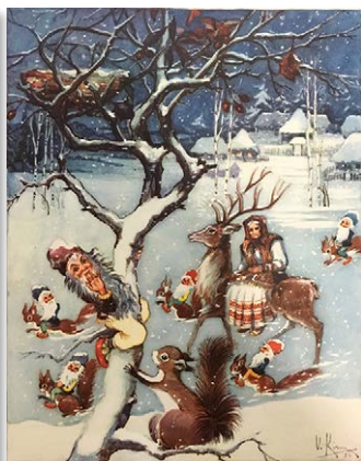
SI. 5. Kirin, 1956. Fig. 5. Kirin, 1956