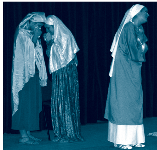
Scenski glazbeni prikaz Gospin plač izveo je dječji zbor i solisti Osnovne škole Vladimir Nazor iz Postira

Osim u Zagrebu, program Pasionke baštine održan je i u Ivanić-Gradu izvođenjem korizmenog oratorija Klupska muka Ljube Stipišića Delmate.