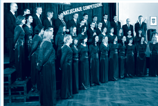
Crkveno pjevačko društvo »Mir« iz Belišća

XVI. međunarodni festival adventskih i božićnih pjesama održan je prvog adventskog vikenda, 1. prosinca 2007. Na festivalu su sudjelovali hrvatski zborovi: Crkveno pjevačko društvo »Mir« iz Belišća, Klapa »Skrijevo« iz Skrijeva, Klapa Subrenum iz Dubrovnika i Šibensko pjevačko društvo »Kolo«. U konkurenciji velikih mješovitih pjevačkih zborova Crkveno pjevačko društvo »Mir« iz Belišća i Šibensko pjevačko društvo »Kolo« osvojili su zlato – »Golden Band«.