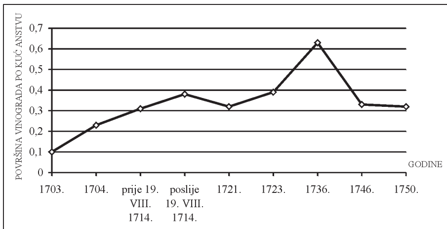
Obrađeni vinogradi po kućanstvu na našičkom vlastelinstvu u prvoj polovici 18. st.

Napuštanje ovog posjeda nije dovelo do znatnijeg smanjenja površina pod vinovom lozom jer je poslije 19. VIII. 1714. godine stanovništvo obrađivalo samo 1 motiku vinograda manje nego prije popisa održanog 19. i 20. VIII. 1714. godine. (Tablica 2 i grafikon 1) Od 46 kućanstava koja su napustila vlastelinstvo samo je jedno obrađivalo 1 motiku vinograda (tablica 3-4), a ovaj posjed su većinom napustile siromašne obitelji. 34 Odlazak kućanstava bez površina pod vinovom lozom rezultirao je povećanjem udjela kućanstava s obrađenim vinogradima 35 i povećanjem prosječne veličine obrađenih vinograda po kućanstvu koja su se uvećala za nešto više od \frac{1}{5} . (Tablica 2 i grafikon 2)