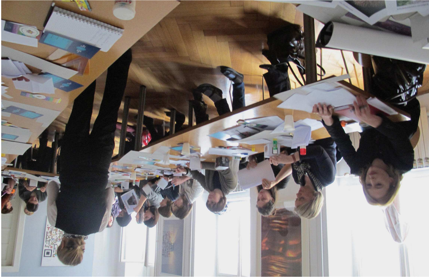
Radionica Muzejske publikacije za djecu i mlade, MDC, 2012.