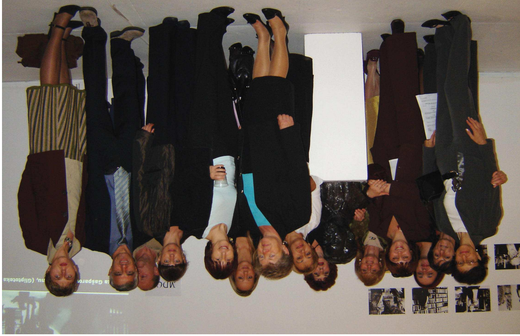
MDC-ovci za 50. obljetnicu MDC-a, 2005.