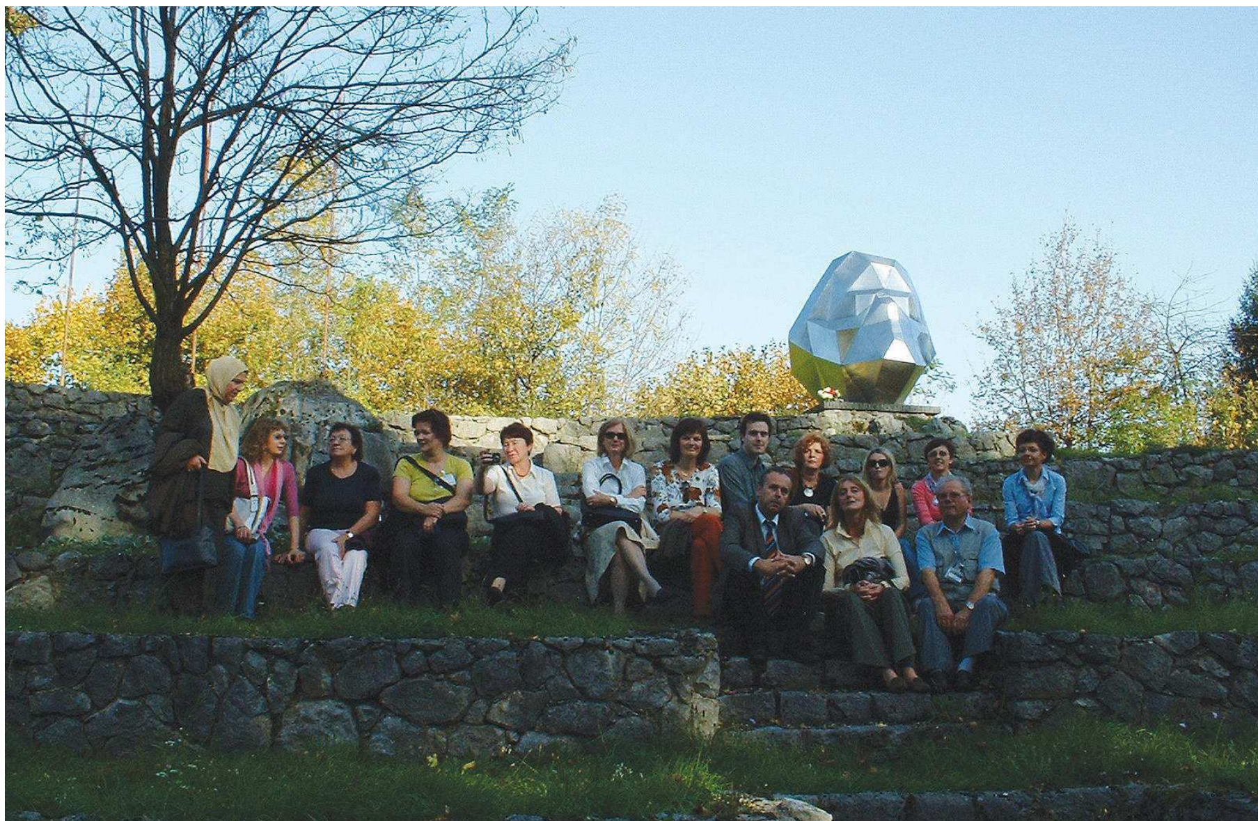
Sudionici međunarodnog simpozija Muzej(i) i književnost(i), na izletu u Goranovom kraju Lukovdolu, listopad 2006.