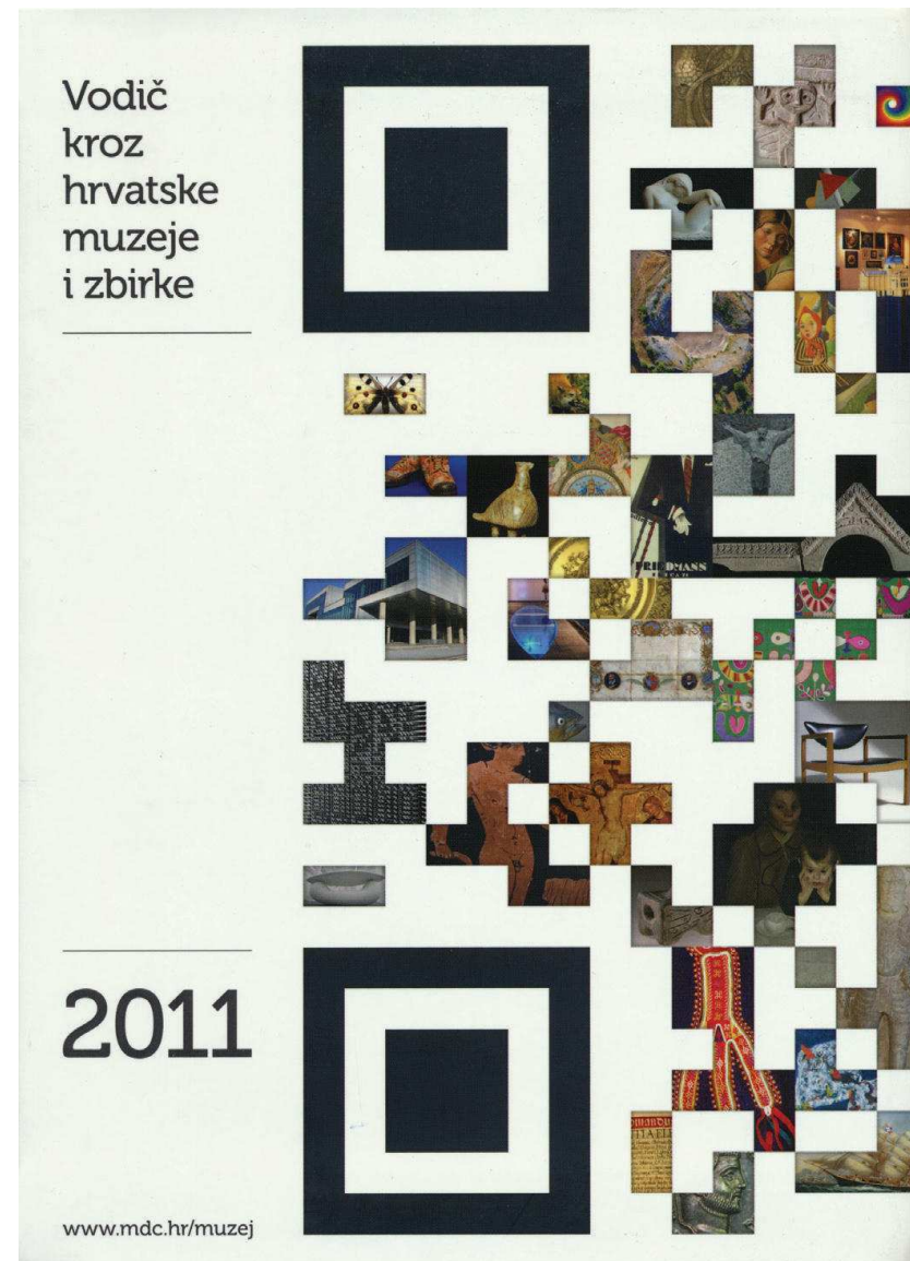
Vodič kroz hrvatske muzeje i zbirke, MDC, 2011.