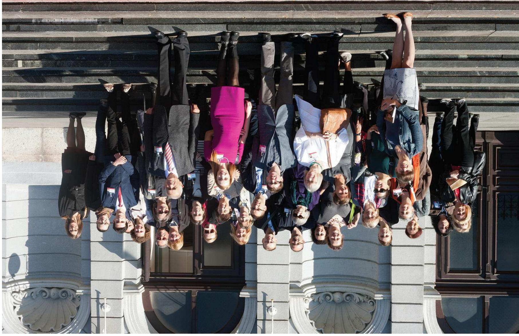
Simpozij Glazba u muzejju / Muzeji glazbe, Muzej Mimara, 2013.