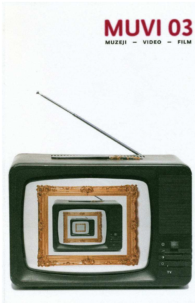
MUVI 03: Muzeji – video - film, MDC, Zagreb, 2010.