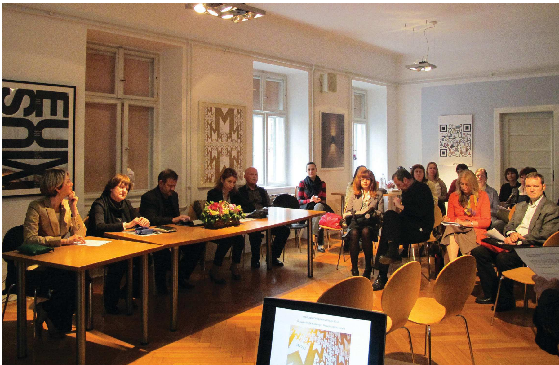
Publika i sudionici okruglog stola Novi izazovi: Muzeji i održivi razvoj, MDC, svibanj 2012.