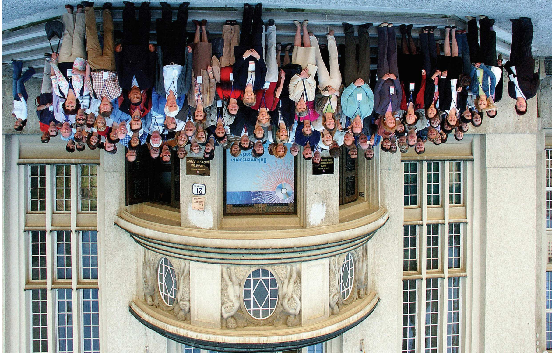
Sudionici CIDOC-a ispred zgrade Hrvatskog državnog arhiva u Zagrebu, 2005.