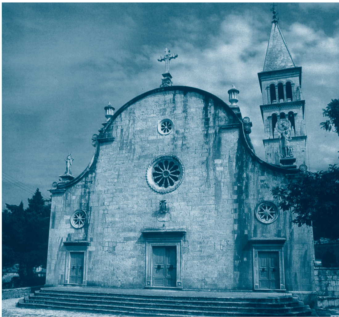
Župna crkva u Nerežišćima na Braču

Nerežiško razdoblje Babarovićeve pastoralne službe obilježavaju četiri njegova rada u Sv. Ceciliji . Prvi članak govori o glagoljskome misalu, koji je u toj inače latinaškoj župi bio namijenjen svećenicima iz obližnje glagoljaške svećeničke pustinje Blaca. 10 Sljedeća dva njegova priloga sadrže tekstove i note pučkih popijevaka iz više nego tisućljetne prošlosti nerežiške župe. To su pjevani molitveni zazivi da se isprosi kiša 11 i euharistijska pjesma kroz nekadašnju tijelovsku osminu. 12 Kao kruna njegovih javljanja s nerežiškom tematikom, i ujedno