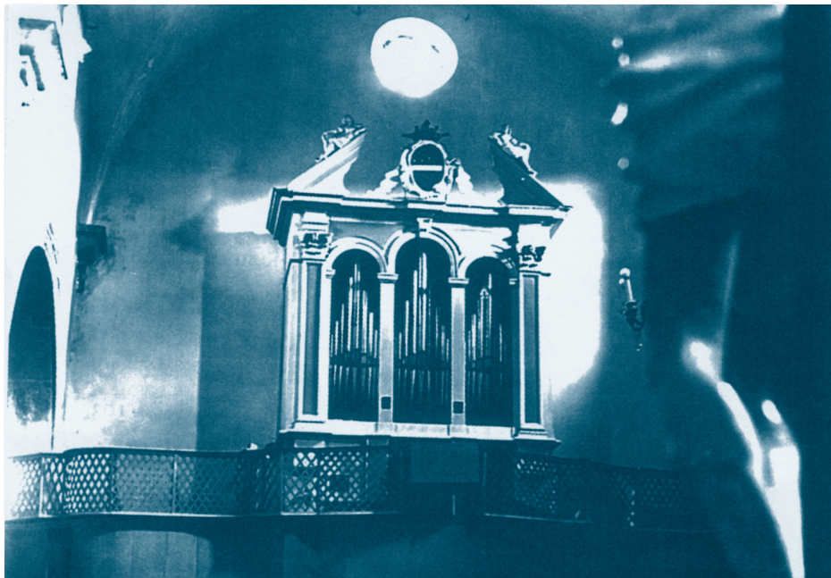
Orgulje graditelja Petra Nakića iz 1753. u nerežiškoj župnoj crkvi