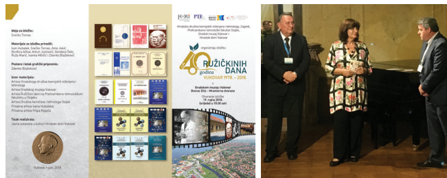
Slika 3 – Letak izložbe "40 godina Ružičkinih dana. Vukovar 1978. – 2018." te njezino otvaranje