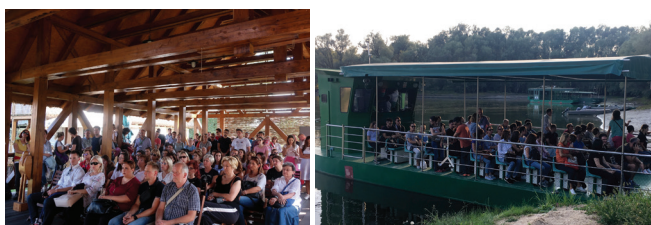
Slika 14 – Izlet u JUPP "Kopački rit"

U četvrtak 20. rujna 2018., nakon prijedodnevno redovnog programa skupa, u poslijepodnevnom satima 130 sudionika skupa na izletu u JUPP "Kopački Rit", upoznali su se s ljepotama tog parka prirode osobito vožnjom s dva broda po vodama kanala u ritu (slika 14). Nakon toga uživali su svi u slavonsko-baranjskim delicijama na zajedničkoj večeri, uz zvuke tamburaša (slika 15).