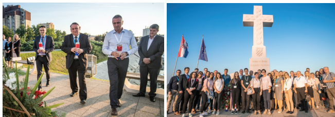
Slika 13 – Odavanje počasti poginulim hrvatskim braniteljima

kod križa na obali Dunava, u spomen svih poginulih hrvatskih branitelja, a osobito onih poginulih u Vukovaru (slika 13).