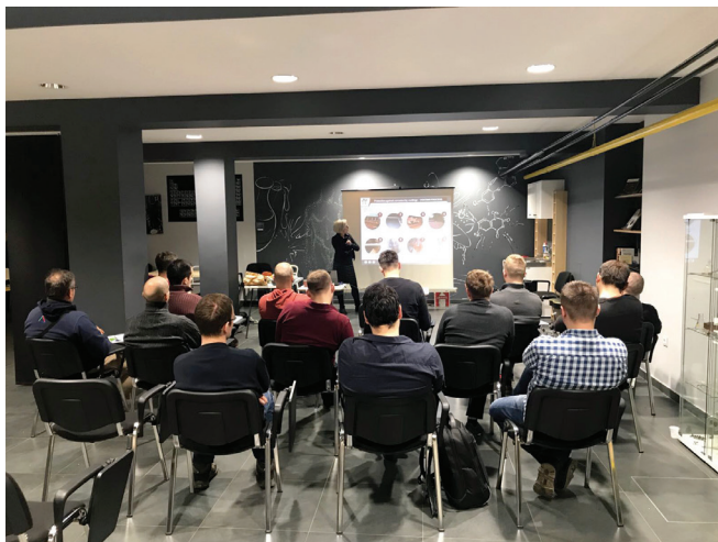
Slika 3 – Seminar o koroziji

inozemni znanstvenici, što doprinosi kvaliteti rada i proširuje istraživačke mogućnosti. Dobiveni rezultati publicirani su u visokorangiranim znanstvenim časopisima kao što su Corrosion Science , Journal of the Electrochemical Society ili Materials and Corrosion .