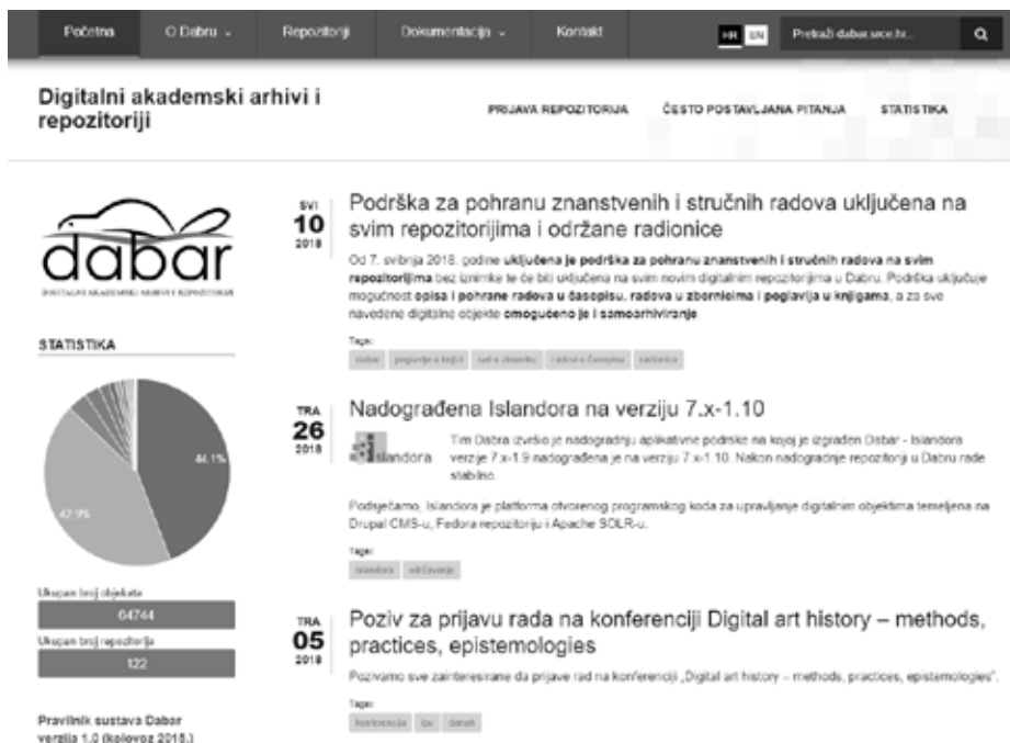
Slika 1. Naslovnica Dabra

tima pristupa i korištenja. Sustav je pušten u produkcijski rad u kolovozu 2015. godine, a do ožujka 2018. godine uspostavlja se 121 repozitorij (slika 1). 14