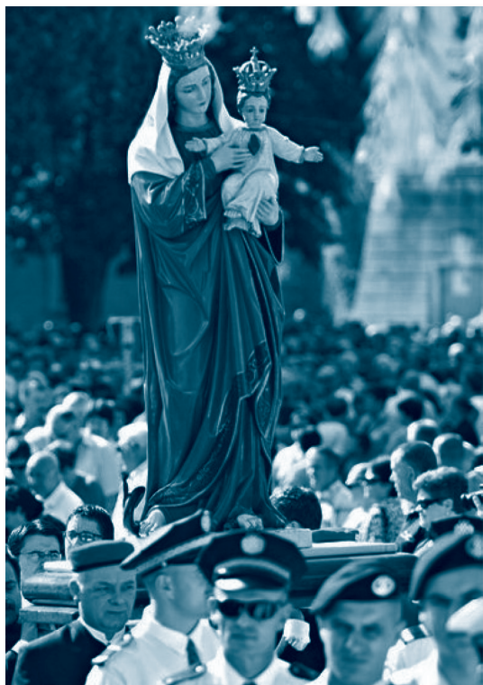
Gospin kip u procesiji

Ni solinska slavlja, ona legendarnih krunjenja i posveta, kao i ova koja pamtimo iz naše novije povijesti – poput proslave Velikoga jubileja godine 1976., blagdana Male Gospe ili pak svečanih godišnjih procesija i misa – ne bi bila potpuna bez glazbe odnosno pjevanja, bilo na latinskom, staroslavenskom ili hrvatskom jeziku.