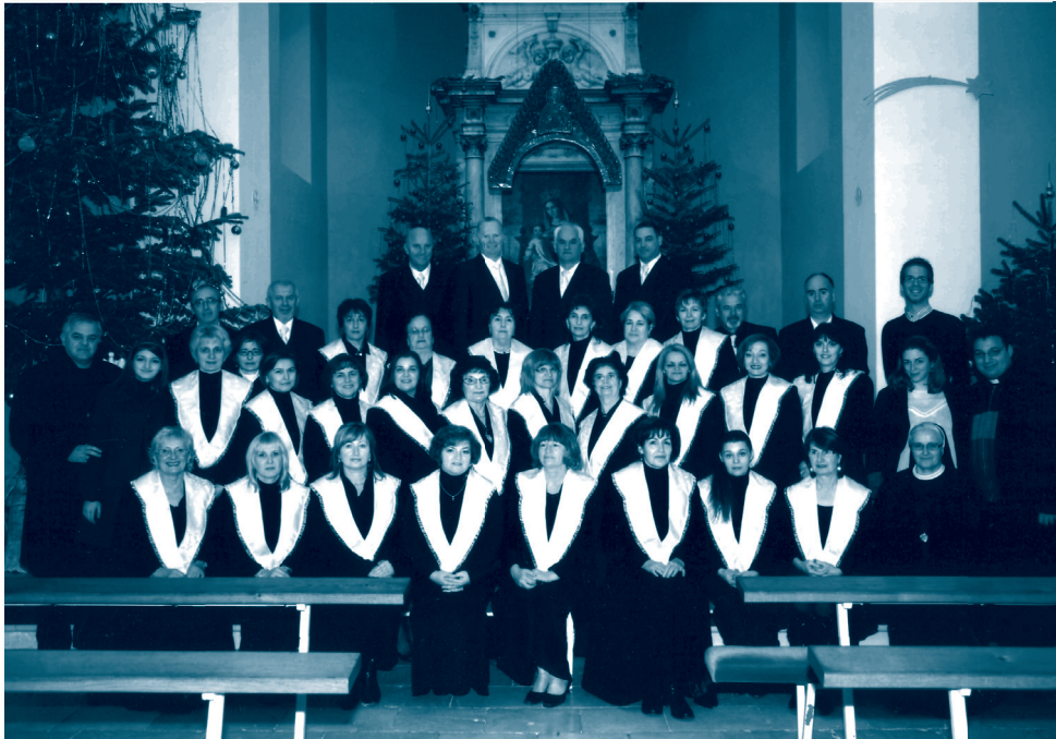
Mješoviti zbor Gospe od Otoka