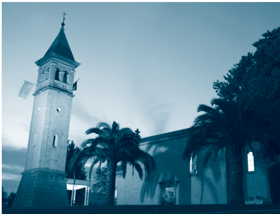
Župna crkva Gospe od Otoka u Solinu

Prije je euharistijska služba započinjala svećenikovim škropljenjem puka (izvan uskrsnoga vremena), dok su za to vrijeme pjevači pjevali Poškropi me šipantom (napjev koji je iščeznuo). Misa je (baš kako se pjeva još i danas) završavala trostrukim zazivom Budi faljeno po sve vrime Isusa, Marije i