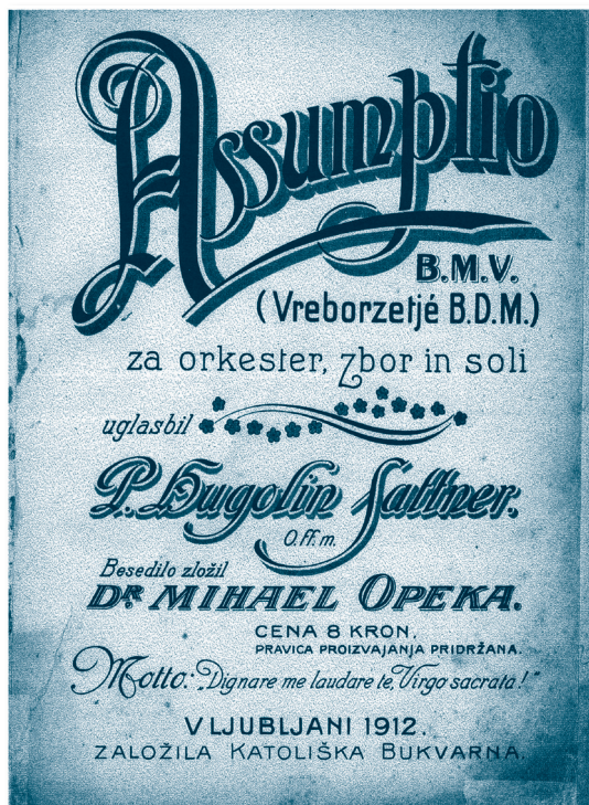
Sattnerov oratorij Assumptio (tisak naslovnice partiture 1. verzije, Ljubljana, 1912.)

Kao odličan i prvoklasan zborovođa svoj je zbor u nekoliko godina podigao na visoki stupanj dotjeranosti u pjevačko-tehničkom pogledu i s njime izvodio bogat repertoar crkvenih skladbi domaćih i stranih skladatelja..