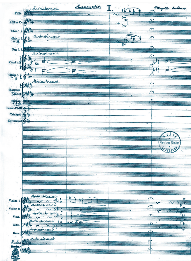
Sattnerjev rukopis, r. Assumptio (1. str. partiture), (2. verzija), Ljubljana 1921.

Sattner u opusu ima i svjetovne skladbe. Bio je stručnjak i na području orguljarstva i zvonarstva. Kao takav sudjelovao je kod različitih dispozicija i kolaudacija orgulja. Brojni i izborni Sattnerovi koncerti dodatno pokazuju da je bio i odličan dirigent. Mnogo je pisao za različite crkvene listove o crkvenoj glazbi, a ujedno je i predavao i učio.