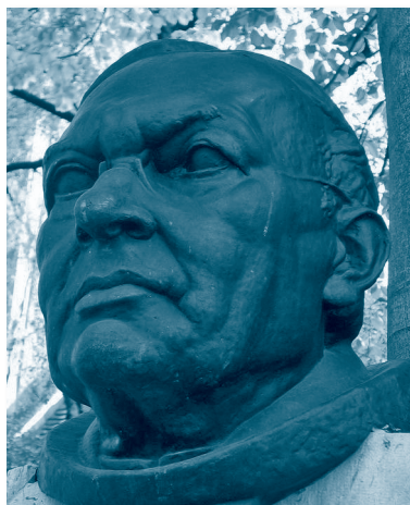
Herma, (poprsje na postolju) H. Sattnera u aleji slovenskih skladatelja u ljubljanskoj Vegovoj ul. 5 (autor: kipar Lojze Dolinar, 1932.)

dobrim savjetima preraditi i zatim ga ponovno obnovljenoga objaviti.« (Sattner, 1912.; 5) Anonimni kritičar je u Slovcu napisao: »Također solisti oratorija (gđe Lovše /Pavla/ i Födransperg /Jeanette/, kao i gg. Križaj /Josip/ i Iličić) dobili su lijepe bukete na dar. Prosudba je stručnjaka da su 2. i 3. izvedba koncerta još bolje uspjele no prva. Zbor i orkestar su nastupili s nekom egzaktnom sigurnošću a i solisti su briljirali. (...) Tko ima više uvida u glazbenu literaturu, morati će priznati da se djelo o. Hugolina može usporediti s boljim i većim djelima stranih skladatelja i donosi čast našem imenu. Mnogo je klasičnih dijelova koja o. Hugolinu osiguravaju jedno od prvih mjesta među slovenskim glazbenicima i u slovenskoj umjetnosti. Nedvojbeno će oratorij pronaći put u široki svijet i pronijeti ime domaćeg skladatelja i u inozemstvu...« ( Slovenec , 1912.; 3) Isto tako je oratorij više hvalio nego kritizirao Stanko Premrl: »Djelo je pisano u jednostavnim, lako razumljivim, umjereno modernim stilom; cijelo djelo je umjereno glasno, a ono što je potrebno posebno naglasiti – izvanredno je iskreno osjećajno. Najbolji je njegov vokalni dio: veličanstveni zborovi i izvanredno lijepe solo