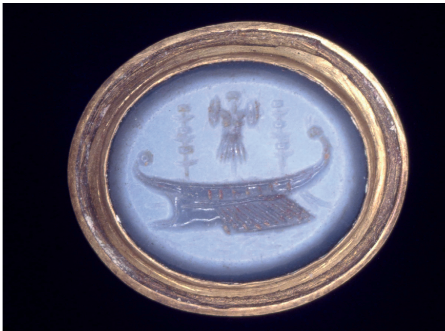
Slika 2. Nikolo intaglio, 15 x 13 mm, 1. st. prije Kr., (prikaz ratnog broda), London, British Museum, reg. number: 1865.0712.195