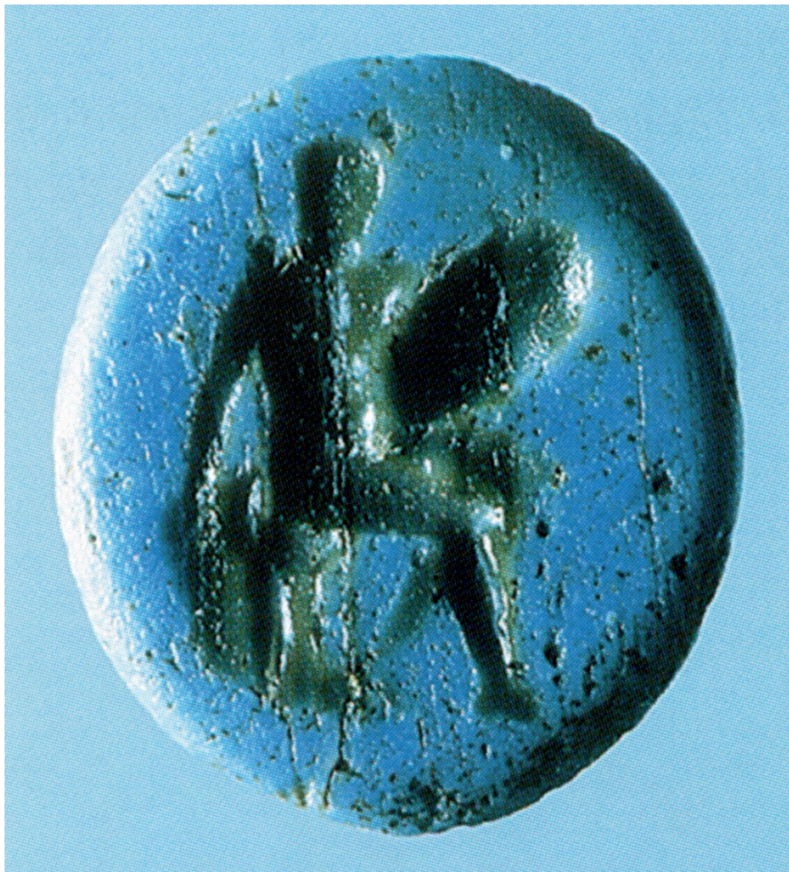
Slika 4. Staklo - imitacija nikolo intaglija, 11 x 10 x 2 mm, bez datacije (prikaz ratnika). Ljubaznošću Muzeja suvremene umjetnosti Zagreb, Arheološka zbirka Benko Horvat inv. br. 550.

Izvor: Remza Košćević, Arheološka zbirka Benko Horvat, kat. 68, Muzej suvremene umjetnosti Zagreb i Institut za arheologiju Zagreb, Zagreb, 2000.