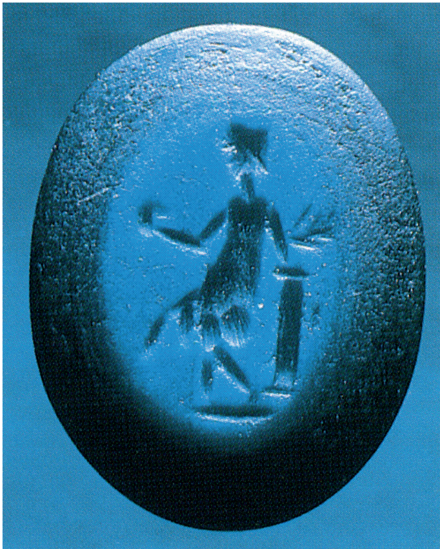
Slika 5. Staklo - imitacija nikolo intaglija, 10 x 7.5 x 3.5 mm, 2. - 3. st. pos. Kr., (prikaz Venere Victrix).

Ljubaznošću Muzeja suvremene umjetnosti Zagreb, Arheološka zbirka Benko Horvat inv. br. 552.