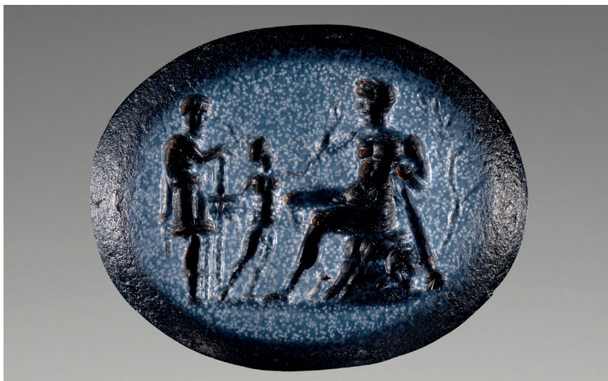
Slika 3. Nikolo intaglio, 14 x 11 x 4 mm, 1. - 2. st. pos. Kr., (prikaz Herakla i Telefa), The J. Paul Getty Museum, object number: 82. AN.162.57