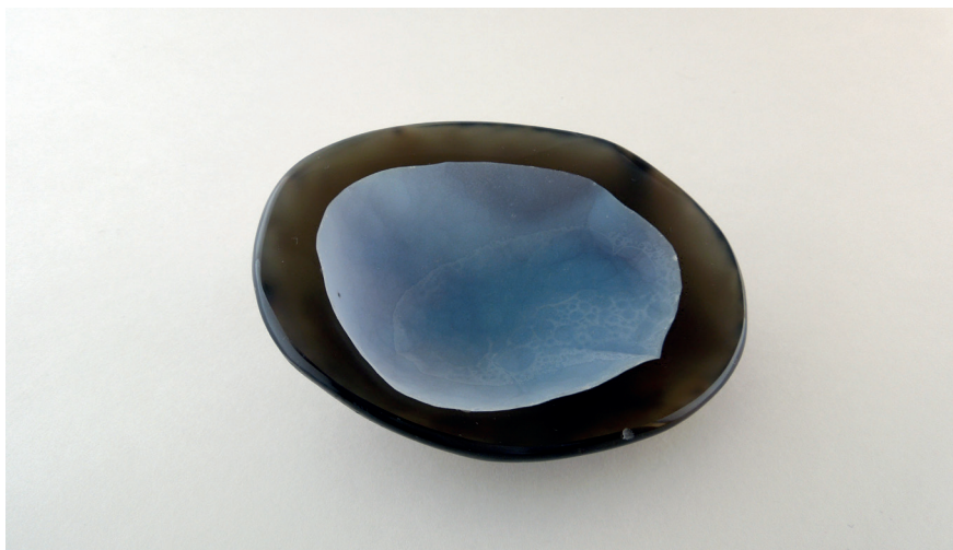
Slika 1. Nikolo ( nicrolo ): mikrokristalasti kvarc osobite polikromije tamnosmedeg (na slici) ili crnog i svijetloplavog sloja; prirodni oblik s poliranom površinom reza, 9,5 x 7 x 2,5cm