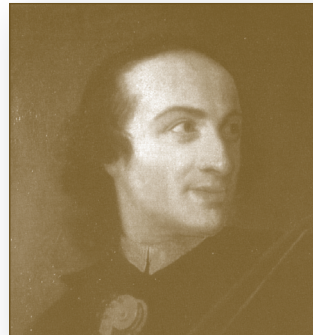
GIUSEPPE TARTINI (8. travnja 1692. – 26. veljače 1770.) – talijanski barokni skladatelj i violinist. Rođen je u Piranu, gradiću na poluotoku Istri, u tadašnjoj Mletačkoj Republici, a današnjoj Sloveniji.

ruke i posebno savitljivi prsti. Možda je i to omogućilo virtuozno sviranje na violini. Smatra se da je imao tzv. Marfanov sindrom, koji je karakteriziran baš takvom tjelesnom građom. Učestale turneje i ekstravagantni život doveli su do bolesti sifilisa. Terapija živom i opijumom imale su ozbiljne fizičke i psihičke nuspojave. Godine 1834., dok je boravio u Parizu, liječi se od tuberkuloze. Sve su te bolesti ostavile velik trag na njegovu karijeru, pa je turneje često morao otkazivati. Patio je od više bolesti, od obične prehlade pa do depresije. U rujnu 1834. g. zaključio je svoju karijeru i vratio se u Genovu. Umro je 27. svibnja 1840., od posljedica unutarnjeg krvarenja. Kako je zbog svog života, postupaka i stavova bio u lošim odnosima s Crkvom, nije dobio dozvolu ukopa na groblju te je tek 1876. g. konačno pokopan na groblju u Parmi.