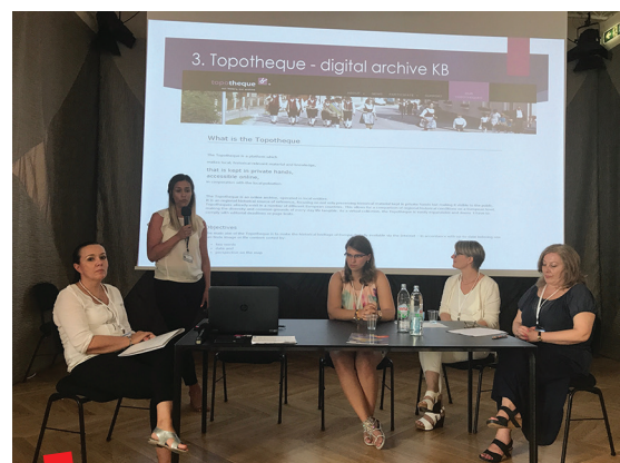
Predstavljanje Topoteke Vilijun na konferenciji Iseljenički turizam – globalna i nacionalna perspektiva u Zadru 1. srpnja 2017.

Suradnici na Topoteci Vilijun zalažu se za kreativna umrežavanja različitih kulturnih identiteta, a svojim su