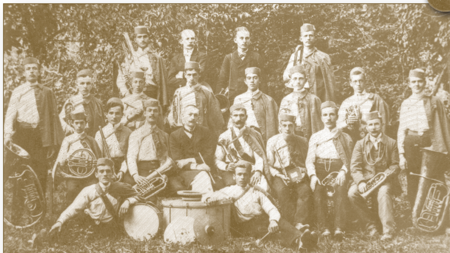
Hrvojeva glazba nakon koncerta 1903. godine

Tako oslabljenog »Hrvoja«, između dvadesetih i tridesetih godina, možda možemo donekle i opravdati, jer izbijanjem Prvoga svjetskog rata 1914. god. »Hrvoju« je prijetila opasnost od potpunog rasula. S umiranjem mladosti na bojišnicama umiralo je i mlado Glazbeno-pjevačko društvo »Hrvoje«. Na kraju Prvoga svjetskog rata ostala je, može se slobodno reći, samo ruševina. Činilo se da se »Hrvoje« nikad više neće obnoviti. ( Kršni zavičaj , 1989., br. 22, str. 53.)