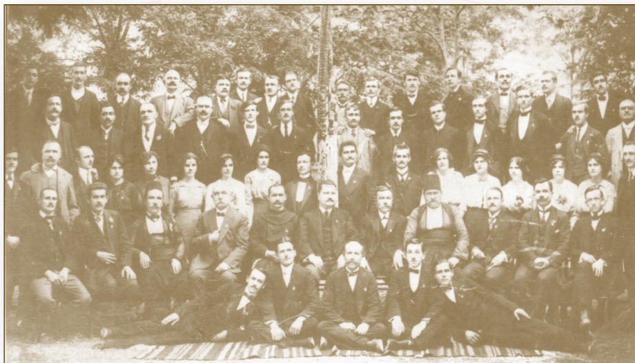
Hrvatsko glazbeno-pjevačko društvo Hrvoje Mostar