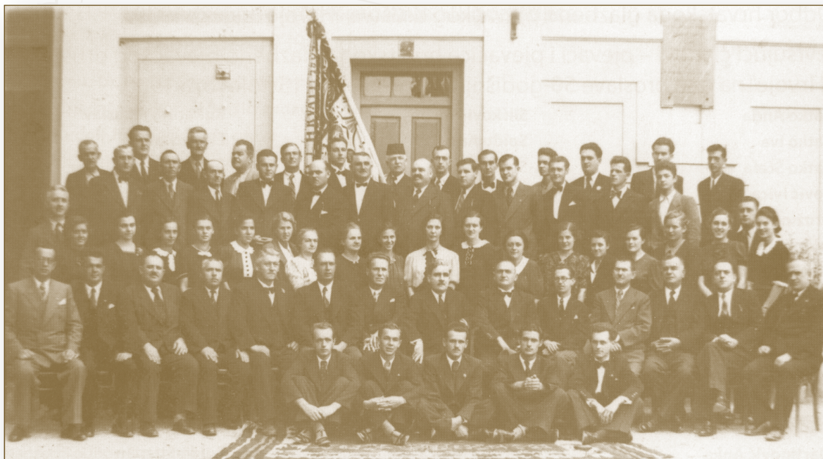
Zbor Hrvoje prigodom proslave 50. godišnjice

Ipak, Klapa »Hrvoje« nastavlja s radom. U suradnji s Hrvatskim domom »Herceg Stjepan Kosača« Mostar, organizira 2004. god. božićni koncert klapa Hercegovini s ljubavlju . Već taj prvi koncert okupio je veći broj hercegovačkih klapa i ujedno potaknuo osnivanje novih u Hercegovini. Njihovi će nastupi s vremenom postati tradicija. U povodu 120. obljetnice osnutka Hrvatskoga glazbeno-pjevačkoga društva »Hrvoje«, 18. prosinca 2008., održan je IV. po redu božićni koncert. Na tom koncertu sudjelovalo je ukupno