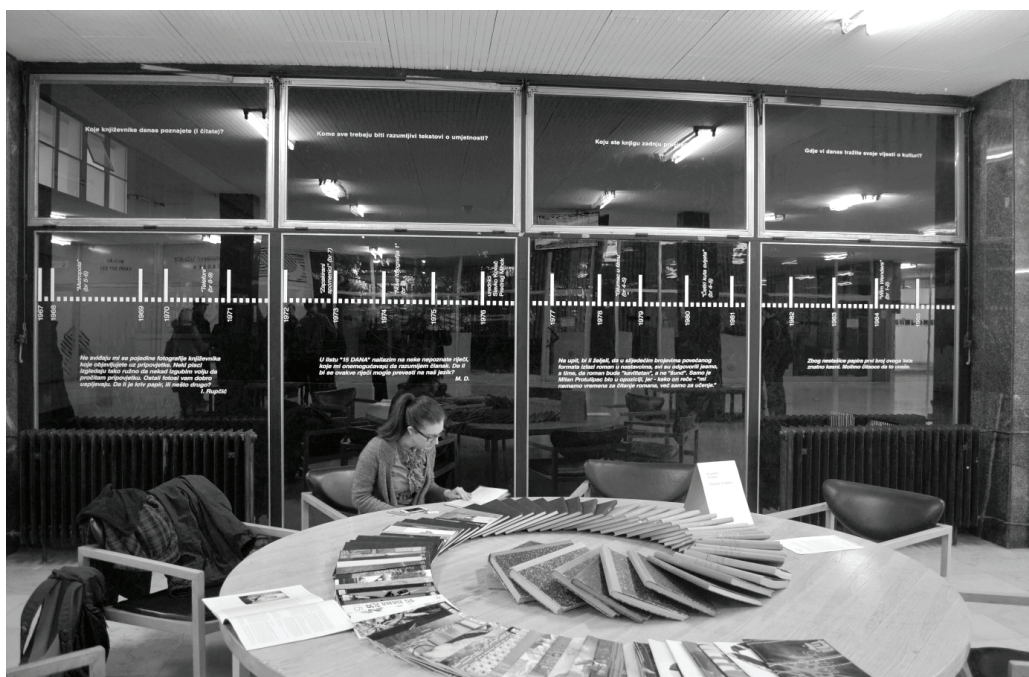
Slika 2: Citati u prostoru

Bivanje u prostoru Učilišta, nekadašnjeg Moše , s jedne strane priziva prošlost, dok istovremeno njegova i dalje živa prosvjetiteljska djelatnost i vizija otvaraju vrata budućnosti. Krećući se tim prostorom, kao da se istovremeno krećemo u oba smjera. Vrijeme tu nije stalo, ono putuje osvrćući se oko sebe da bi se prisjetilo i potegnulo neke od olabavljenih niti. Svih 60 godina 15 dana živi zajedno s prostorom, a kroz ovu instalaciju u toj pukotini između vremena postavljaju ponovno pred pitanja o vitalnosti našeg duha i vitalnosti našeg vremena, i o ulozi kulture i umjetnosti u njemu. Čitajte 15 dana i ubuduće, i unazad, svih 60 godina.