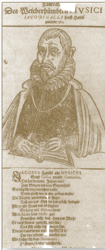
I. Handl Gallus, 1593.

Gallusova opusa u cjelini. Osvijetljena su tako Gallusova individualna glazbena tiskana djela, kao i antologije iz 16. i 17. st., koja su u recepciji njegove glazbe igrala značajnu ulogu. Autor uključuje u studiju i aspekte izvođačke prakse. Tako je, naprimjer, jedno od poglavlja posvećeno prijepisu Gallusovih djela u tabulature (instrumentalno notno pismo koje se koristilo od 14. do 18. st.) za glazbala s tipkama i lutnju. Motnik se dalje posvećuje glazbeno teoretskim spisima 16. i 17. st., koji navode Gallusova djela. Kao posebno uspješan primjer recepcije određena Gallusova opusa prikazuje raširenost i značenje njegova moteta Ecce