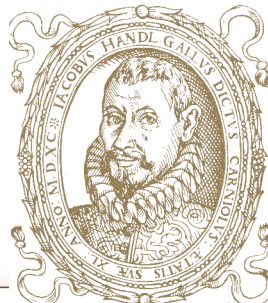
I. Handl Gallus, 1590.