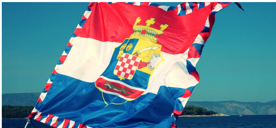
Zastava s heraldičkom reinterpretacijom kraljevinskih (zemaljskih) grbova hrvatskih zemalja