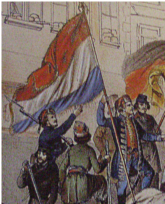
SLIKA 4., Trobojna zastava crven-bijeli-plavi na Slavenskoj barikadi u Beču 1848., kasnije prihvaćena u Gajevim Narodnim novinama kao opće narodni simbol

Prestankom zabrane nacionalnih-narodnih zastava te dolaskom na bansku čast bana Josipa baruna Šokčevića 1860., njegov izbor slične inačice grba i zastave 29 , kao pri instalaciji bana Jelačića, stvara uvjet i potvrdu kontinuiteta trobojnice u banskim zastavama koje u hrvatskoj veksilologiji čine glavni državni stijeg. Uz bansku zastavu počinje uporaba hrvatskih trobojnica kao narodnih,