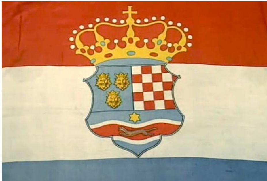
SLIKA 6., Hrv. zastava s okrunjenim grbom Tro. Kr. Hrvatske, Dalmacije i Slavonije. Kruna na grbu je heraldička umjesto Stjepanova (poslije 1876., izv. HPM)

Iako su s vremenom vrlo strogo određeni oblik i način uporabe grba i zastave, već od samoga početka uporabe u 19. stoljeću, u samoj narodnoj, no često i općinskoj i županijskoj uporabi, dolazi do velikih odstupanja i nepravilnosti. Već ranije napomenut primjer uporabe grba Trojednice s heraldičkom krunom kao predstavnikom krune sv. Stjepana (slika 6), prvi je korak vizualnoga osamostaljenja i različitosti.