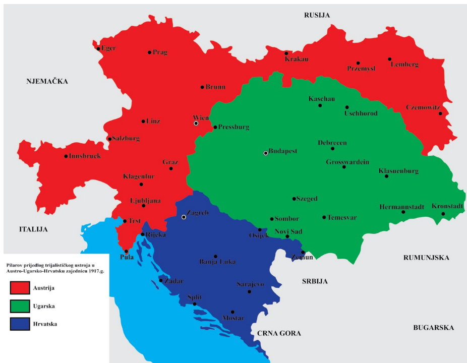
SLIKA 7., Pilarov prijedlog preustroja dualne Austro-Ugarske Monarhije

Upravo u tom djelu ističe da uz geopolitičku prijetnju raspada K. u. K. monarhije pod utjecajem Italije s jedne i Srbije s druge strane, Monarhiju najviše pogađa trenutna upravna podjela hrvatskih zemalja u dualističkom sustavu. Rješenje toga gorljivoga pitanja, iako otklanja trijalistički prijedlog ujedinjenja svih južnoslavenskih zemalja, 67 vidi u ujedinjenju Hrvatske, Slavonije, Dalmacije te Bosne i Hercegovine u jednu zasebnu (treću) državnu cjelinu. 68 Njezin najbrži put prema ujedinjenju vidi u tom trenutku sjedinjenjem Kr. Hrvatske i Slavonije te Kr. Dalmacije s Bosnom i Hercegovinom, čiji posebni položaj daje