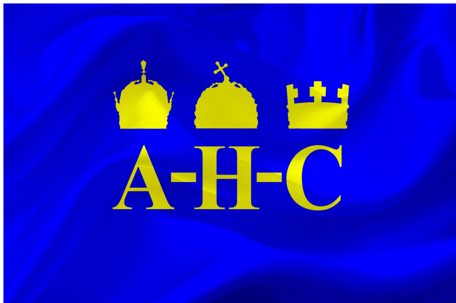
SLIKA 10., Rekonstrukcija mogućeg izgleda Bjelovučićevoga prijedloga trijalističke diplomatske zastave, čime bi Monarhija dobila jedinstven veksilološki simbol

Uporabom tipografskoga prijedloga trojne monarhije riješeno je pitanje zajedničkoga predstavljanja. Među predloženim zastavama nalazi se i ona diplomatska koja bi predstavljala K. u. K. monarhiju u cjelini tijekom prisutnosti poslanika. Slično kao i kod prethodne zastave, zastavu čine slova A-H-C, dok je osnova na kojoj su položeni modre boje. 82 Primjer rekonstrukcije takve zastave može se vidjeti na slici 10. Bjelovučić u svojim prijedlozima vidljivo pokazuje utjecaj tradicije i uporabe inačica hrvatskih zastava na Jadranu, pogotovo onih prisutnih na brodovima hrvatskih brodarskih tvrtki. Zajedničke inačice za predloženu trijalističku K. u. K. monarhiju najvjerojatnije uzima na uzorima proizišlima iz tradicije brodarskih oznaka ili stjegova s inicijalima.