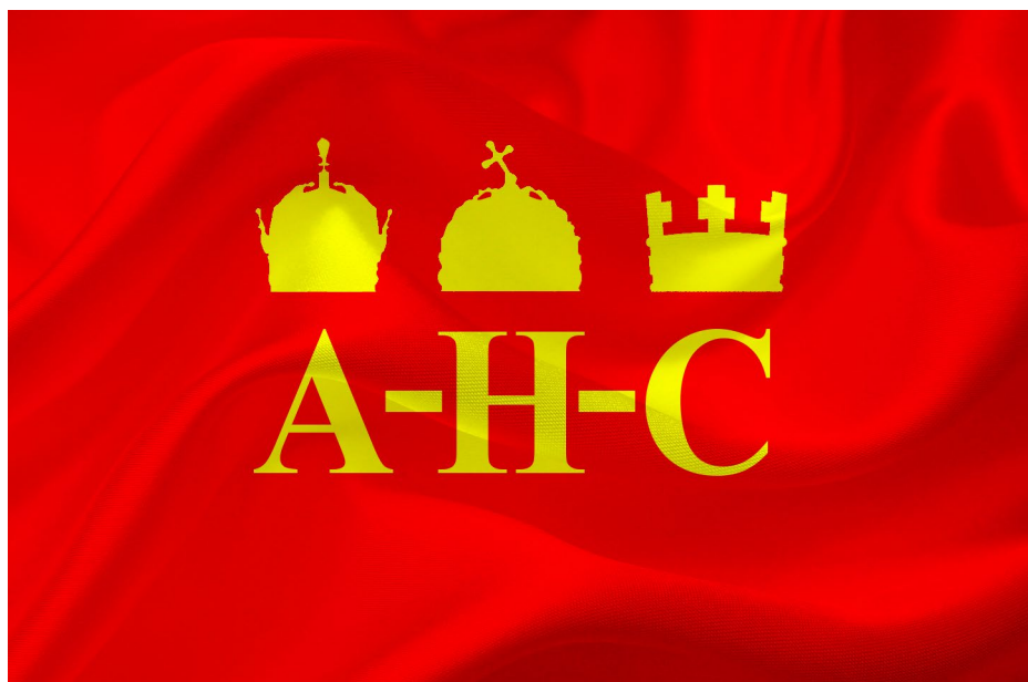
SLIKA 9., Rekonstrukcija mogućeg izgleda Bjelovučićevoga prijedloga trijalističke pomorske zastave