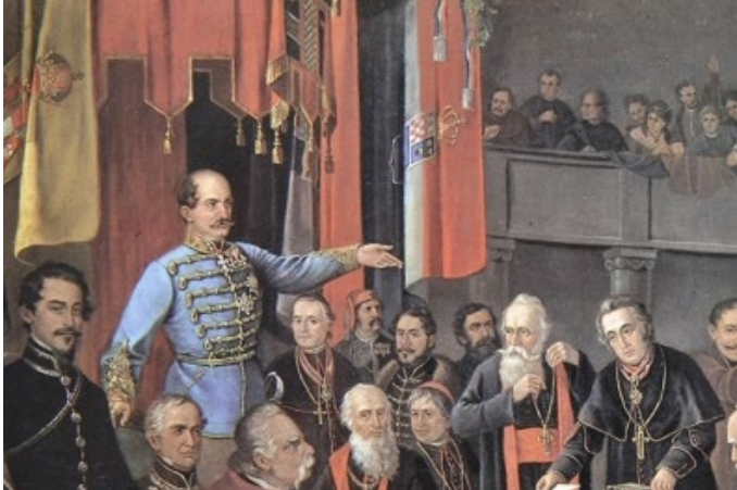
SLIKA 5., Sabor Kr. Hrvatske... 1848., Dragutin Weingärtner. Trobojna hrvatska zastava s okrunjenim grbom Trojedne Kr. Hrvatske, Dalmacije i Slavonije

vojnih i državnih zastava. Jedina je veća razlika u uporabi grba koji ponekad (ovisno o inačici) ima ili nema ilirski nadgrb. 30 Prema slikama Sabora i bana, možemo zaključiti da je službena državna zastava koja je nosila grb imala obje inačice, no prednost se (pogotovo vezano uz vladara i ostatak Monarhije) davala onoj bez ilirskoga nadgrba 31 (slika 5).