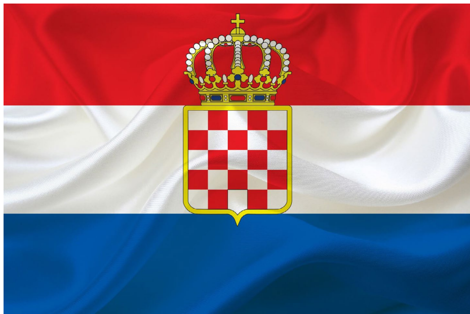
SLIKA 8., Hrvatski grb okrunjen heraldičkom krunom. Kao pomorska zastava korištena je od 19. st. na Jadranu, prema Bjelovučiću koristila bi se kao i državna