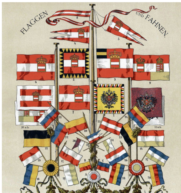
SLIKA 1., Pomorske, državne i narodne zastave u K.u.K. monarhiji