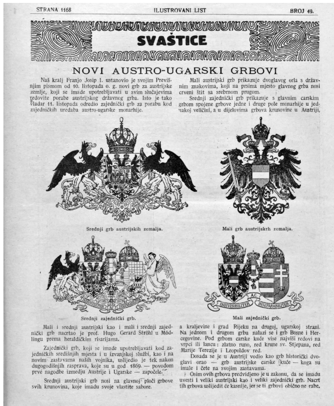
SLIKA 2., Novi grbovi propisani 1915. Zajednički srednji grb pokazuje heraldičko rješenje kompliciranog opisa i odnosa krunskih zemalja u Monarhiji (izv. IL)

jedinstven primjer za cijelu K. u. K. monarhiju ili njezine dvije glavne cjeline. 16 Službeno, kao što je vidljivo i u odredbama Hrvatsko-ugarske nagodbe iz 1868., koriste se tri zastave koje predstavljaju austrijsku i ugarsku-hrvatsku cjelinu. 17