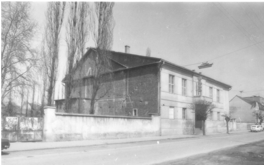
Zgrada Doma kulture u Đakovu, nekadašnjeg Hrvatskog doma. Snimak načinjen 1978. godine.

lo da će u njemu društvo naći svoje društvene prostorije. 5 Možemo pretpostaviti da je odbor osnovan na inicijativu Hrvatskog sokola u Đakovu.