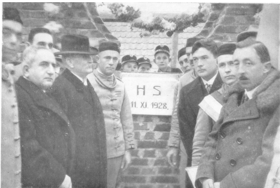
Polaganje kamena temeljca za Hrvatski sokolski dom u Đakovu dana 11. studenoga 1928. godine.

štvo upravne općine Đakovo. 30 Tako se trgovište Đakovo osiguralo od mogućnosti da zemljište u slučaju likvidacije društva, koja je prijetila, prijeđe bilo u državno ili neko drugo vlasništvo. Zemljište je bilo veličine 504 četvorna hvata, odnosno 1813m 2 . 31 Hrvatski sokol je platio za prijenos vlasništva pristojbu od 2.400 dinara, a molba poslana Ministarstvu financija kojom se tražio oprost pristojbe bila je odbijena. 32