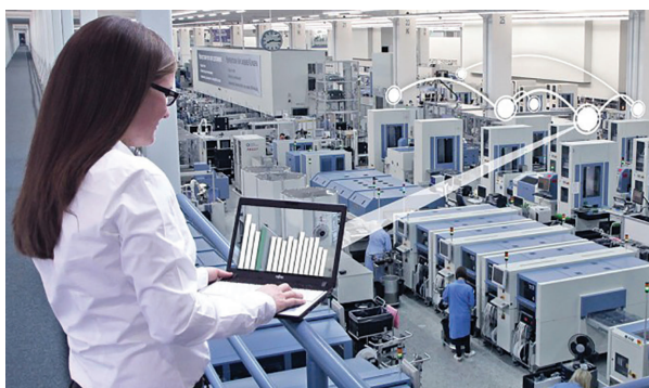
Slika 2 Siemensova tvornica elektronike u Ambergu, Njemačka [12]

Optimalno će reagirati na promjenjive zahtjeve tržišta, kooperacijske procese, zakonske i financijske promjene te na potrebu za specifičnim znanjima visokoobrazovnih stručnjaka. Sigurno je utjecaj obostran jer je tako nastala „pametna tvornica“ bitan čimbenik promjena u društvu i obrazovne politike. U žiži napretka su inovacije nastale, ne samo u vlastitoj sredini, već i na sveučilištu ili iz zajedničkih projekata. [1]