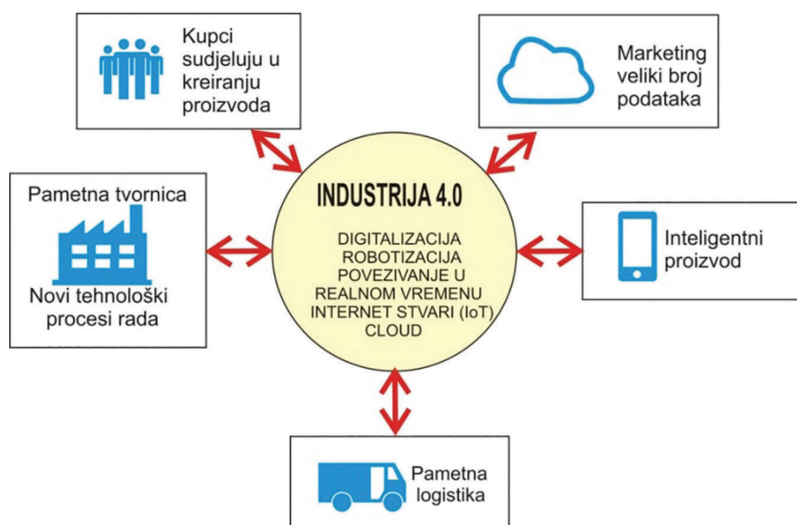
Slika 1 Koncept Industrije 4.0 – rezultat su jeftini personalizirani proizvodi dostavljeni na vrijeme kupcu [6] [10]

Iako je mnogo suvremenih industrija digitalizirano, još od trenda uvođenja CIM-a (Computer Integrated Manufacturing - računalom objedinjena proizvodnja), pred nešto više od četrdeset godina, ipak treba kod većine industrije napraviti novi korak daljnje digitalizacije povezujući sustav upravljanja proizvodnim procesima unutar tvrtke sa sustavima izvan, odnosno tržištem, dobavljačima, distribucijom, bankama, državanom upravom, inovacijskim subjektima, obrazovnim institucijama i dr. Za ostvarivanje tog cilja danas na raspolaganju stoji razvijena suvremena oprema, integrirana s informatičkim sustavima, programski paketi s otvorenim pristupom (open source), s kojima je moguće sve umrežiti, promptno ažurirati i prilagoditi traženim zahtjevima. Moderna proizvodna sredstva su objedinjena s računalnom tehnikom, prijenosom i obradom podataka (kibernetičko-fizički sustav-CPS). Tvornica je umrežena, ugrađen je veći stupanj umjetne inteligencije, bogata sensorika, i ostvarena mogućnost komunikacije opreme s ljudima (M2H – Machine To Human), mogućnost komunikacije s drugim robotima i strojevima (M2M – Machine To Machine), ali i komunikacija s proizvodima (slika 2) [4] [5].