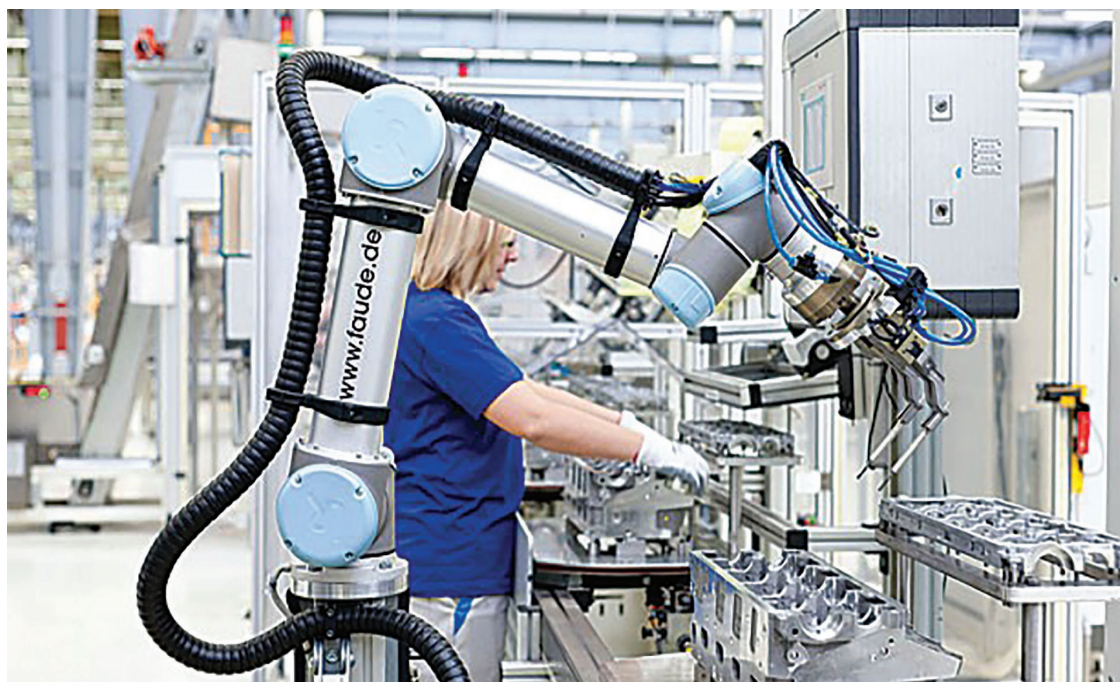
Slika 5 Suradnja kobota UR10 i radnika u industriji motora [19]