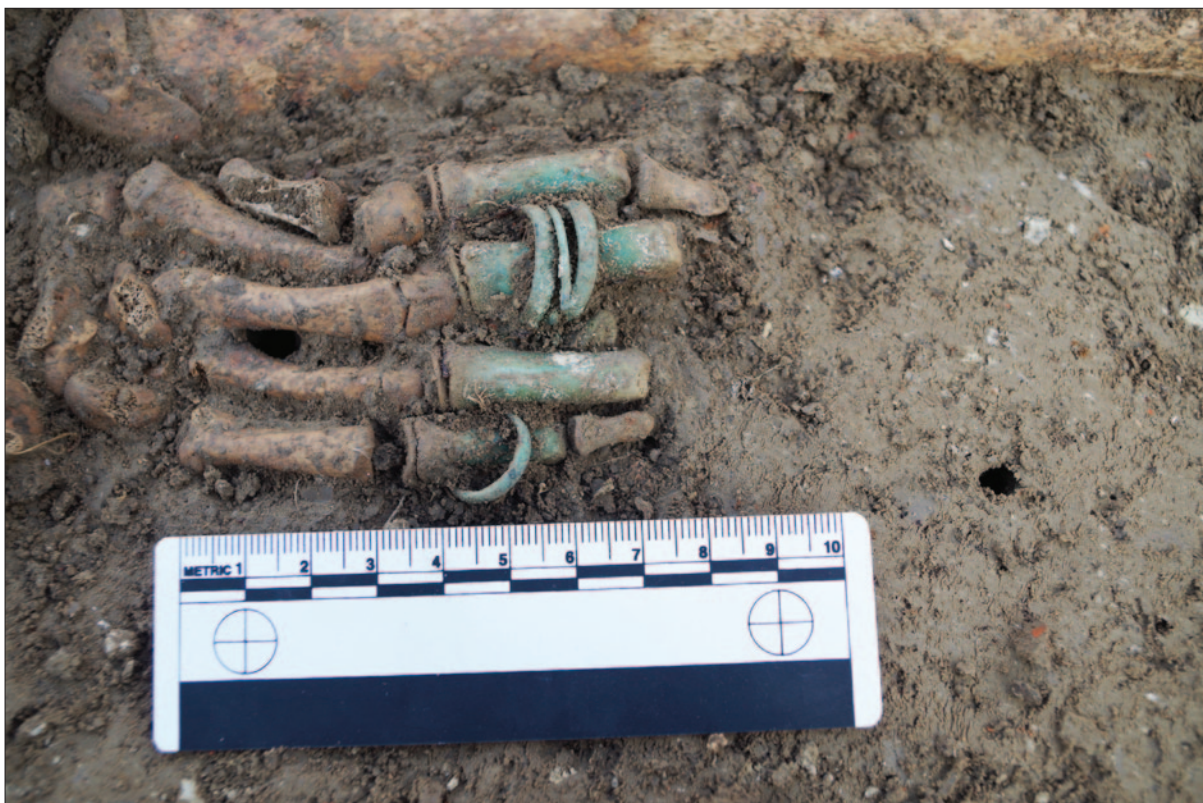
Sl. 5 Prstenje iz groba 65 in situ